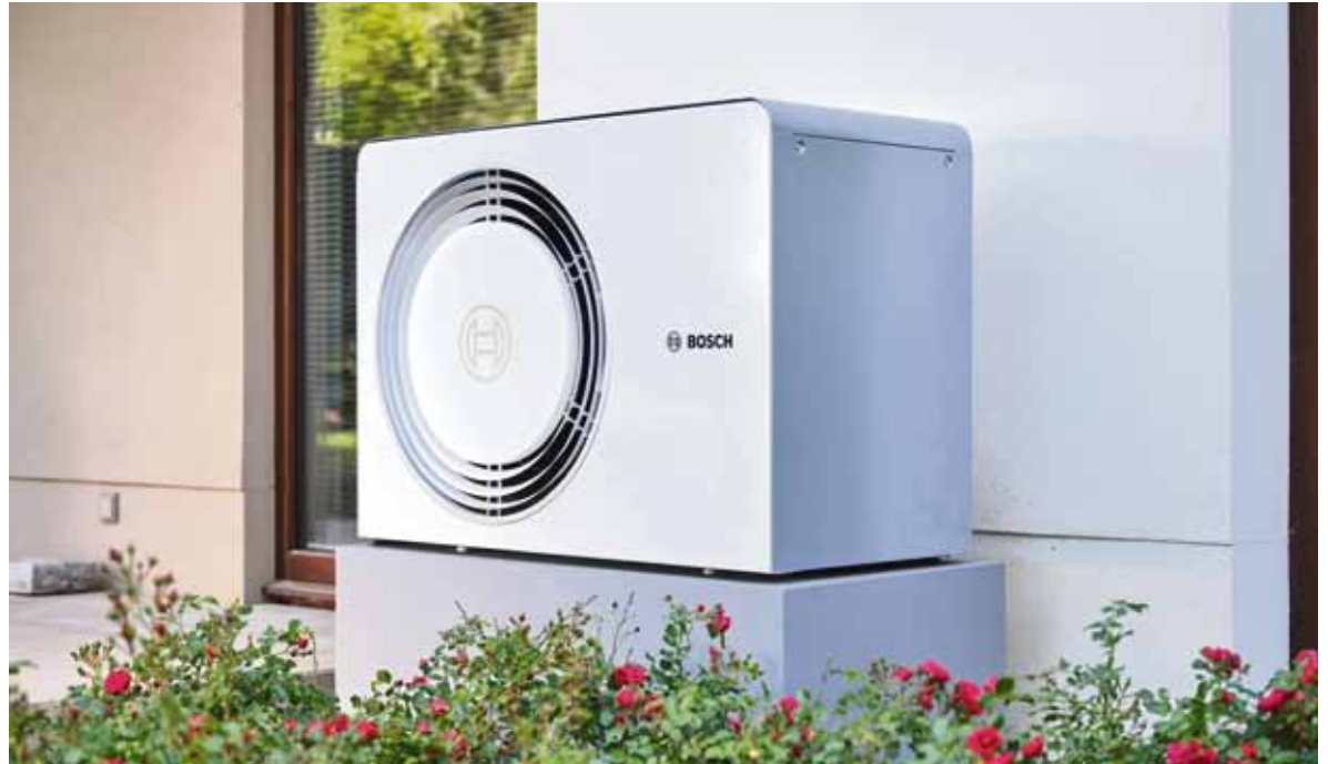
Wärmepumpen, die ein natürliches Kältemittel nutzen, verbinden hohe Effizienz mit Umweltfreundlichkeit.

Gleichzeitig kann es Wärme besonders effizient übertragen, was zu geringeren Betriebskosten führt. Hersteller wie Bosch Home Comfort setzen bereits auf das natürliche Kältemittel R290. Luft-Wasser-Wärmepumpen wie Compress 5800i AW oder Compress 6800i AW ermöglichen auf diese Weise eine zukunfts-sichere Wärmeversorgung. Unter www.bosch-homecomfort.de gibt es mehr Details.