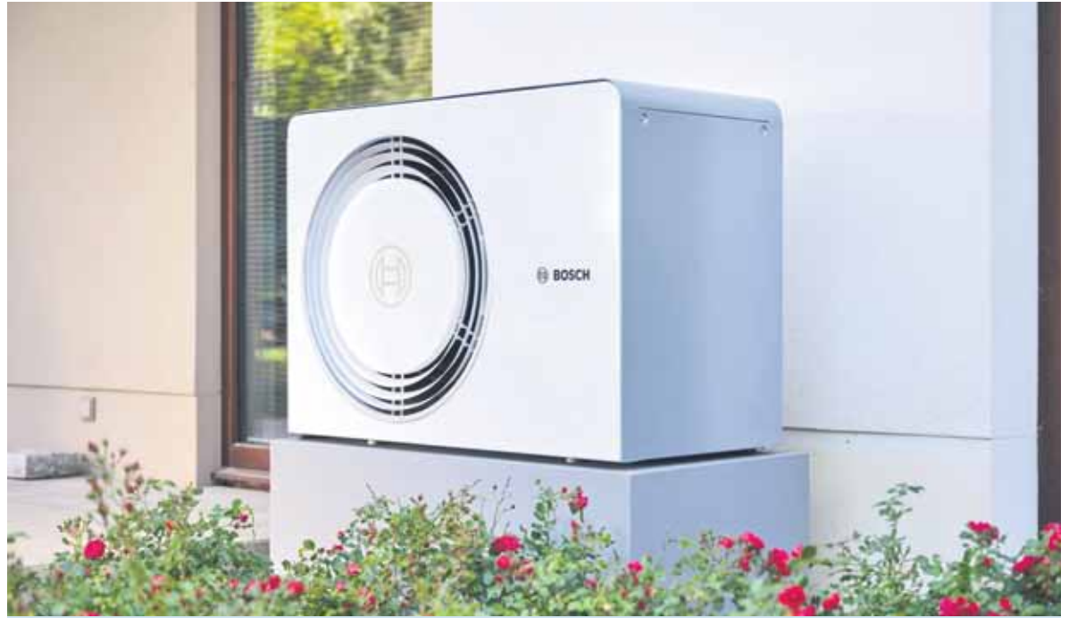
Wärmepumpen, die ein natürliches Kältemittel nutzen, verbinden hohe Effizienz mit Umweltfreundlichkeit.

Gleichzeitig kann es Wärme besonders effizient übertragen, was zu geringeren Betriebskosten führt. Hersteller wie Bosch Home Comfort setzen bereits auf das natürliche Kältemittel R290. Luft-Wasser-Wärmepumpen wie Compress 5800i AW oder Compress 6800i AW ermöglichen auf diese Weise eine zukunfts-sichere Wärmeversorgung. Unter www.bosch-homecomfort.de gibt es mehr Details.