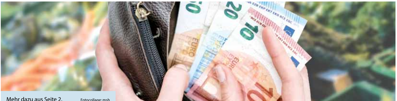
Mehr dazu aus Seite 2.