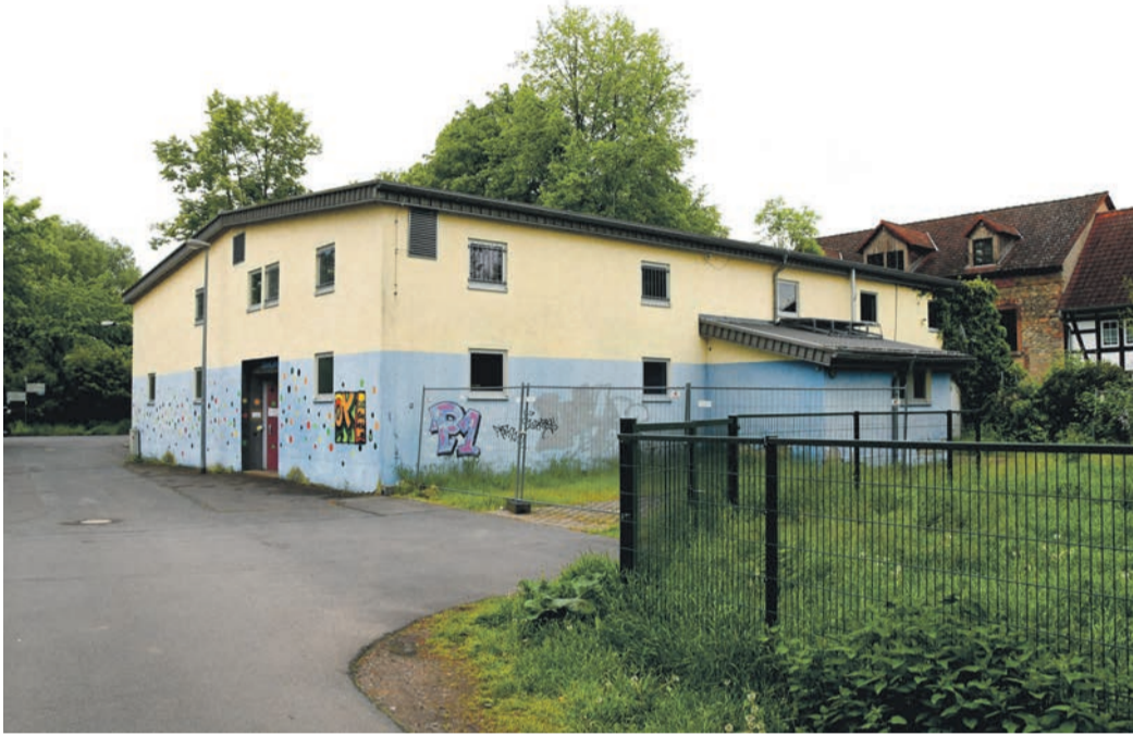
Das Comeback des Jugendzentrums im Gebäude „Bahnhofstraße 52“ zwischen Wanderheim und Langsmühle rückt näher.