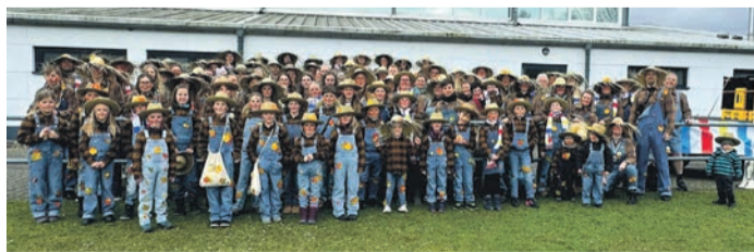
DJK-Familie: 111 fröhliche Gesichter.