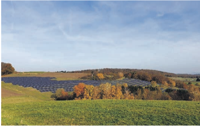
Der Bürgersolarpark Klein Bieberau (Gemeinde Modautal) ist ein gemeinsames Projekt der ENTEGA mit der Energiegenossenschaft Odenwald und soll Ende 2024 in Betrieb gehen.