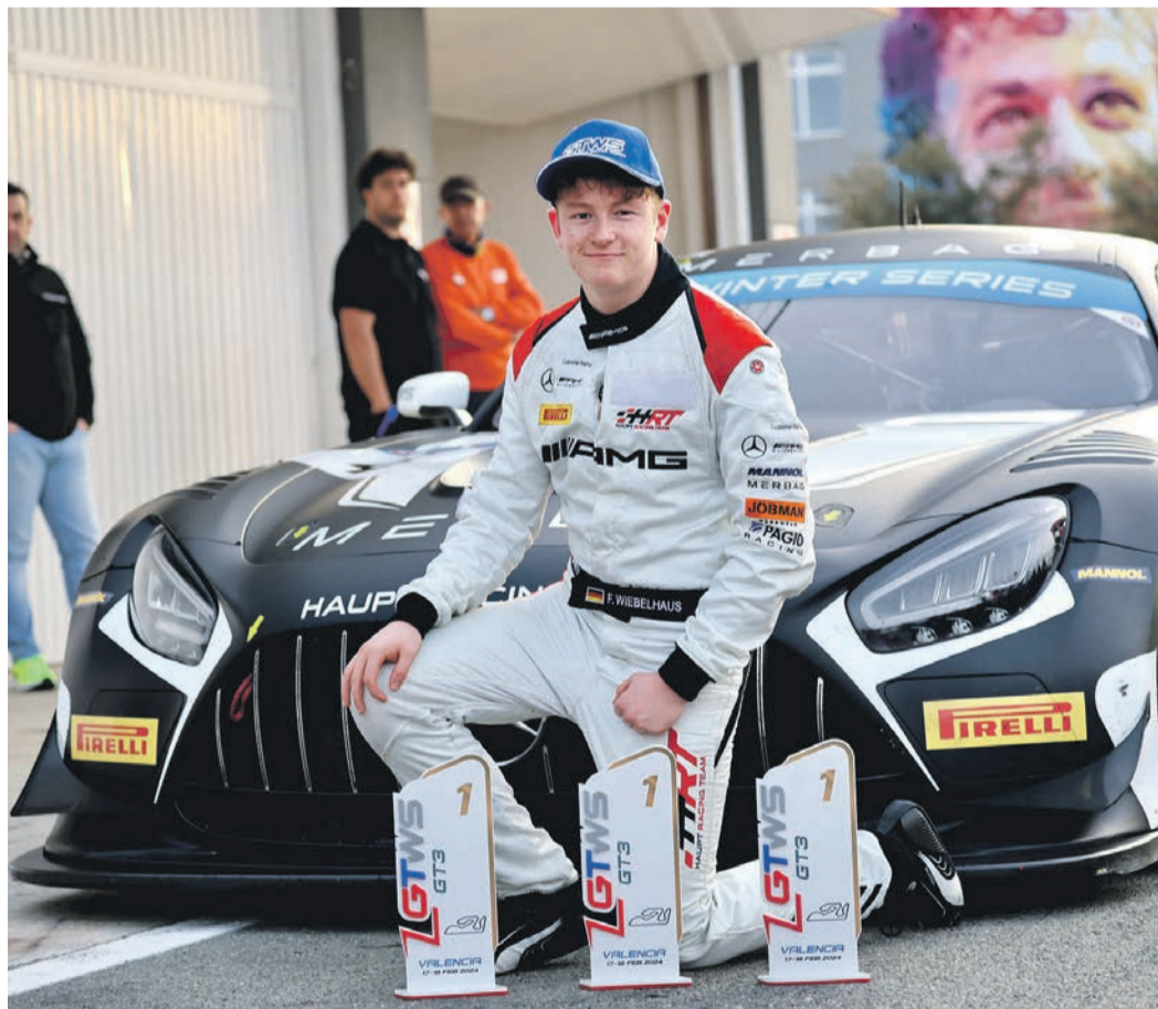
Dreifachsieg bei GT Winter Series in Valencia.