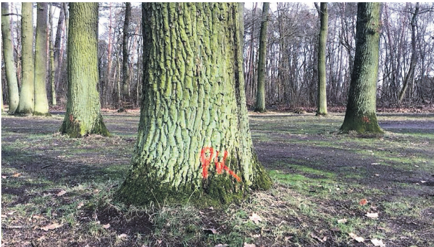
Keine guten Nachrichten: 50 Eichen müssen beim Waldpark gefällt werden. Bei diesen haben Fachleute einen Befall des Eichenprachtkäfers festgestellt. Für die anstehende Fällung wurden die betroffenen Bäume bereits markiert.