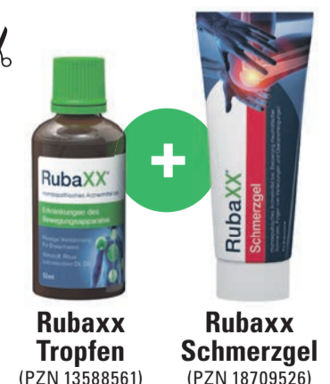
Rubaxx Tropfen (PZN 13588561)