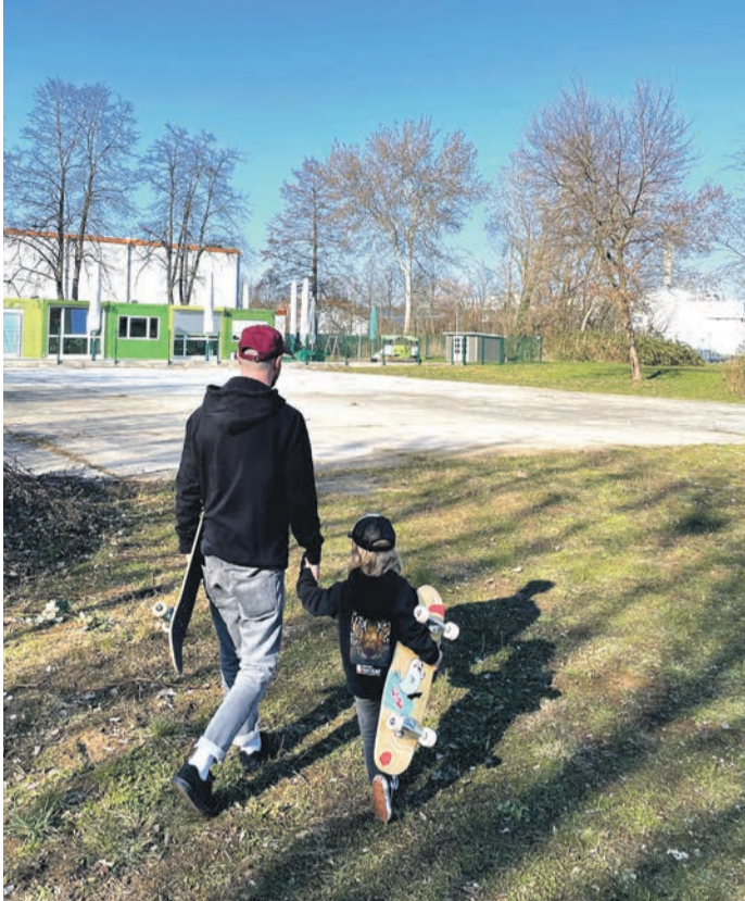
Auf dem Gelände zwischen der städtischen Sporthalle an der Rodastraße und der Schubertstraße könnte der Skate- und Jugendpark entstehen.