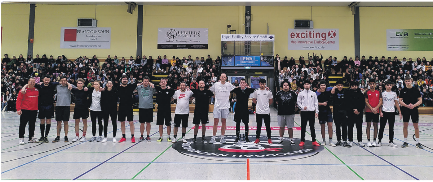
Lehrer gegen Schüler hieß es vergangene Woche beim Benefizspiel der Heinrich-Böll-Schule.