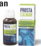
Abbildung Betroffenen nachempfunden. PROSTATEALMAN. Wirkstoffe: Serenoa repens Ø, Pareira brava Ø, Populus tremuloides Dil. DZ. Prostatealman wird angewendet entsprechend den homöopathischen Arzneimittelbildern. Dazu gehören: Blasenentzündungen und Beschwerden beim Wasserlassen, bei vergrößerter Prostata. www.prostatealman.de • Zu Risiken und Nebenwirkungen lesen Sie die Packungsbeilage und fragen Sie Ihre Ärztin, Ihren Arzt oder in Ihrer Apotheke. • PharmaSGP GmbH • 82166 Gräfelfing

Für Ihre Apotheke: Prostatealman (PZN 13588549)