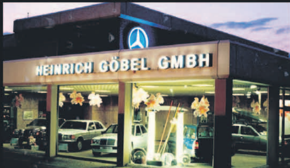
1997 Der Ausstellungsraum wird um ein dreifaches vergrößert und das 1. OG wird weiter ausgebaut.