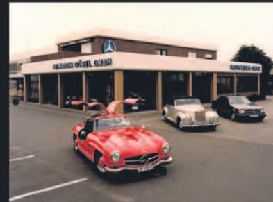
1982 Der Standort in Neu-Isenburg wird um einen verglasten Ausstellungsraum und ein 1. OG erweitert.