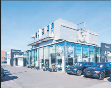
2024 Heute ist Neu-Isenburg Hauptstandort der 10 Filialen.