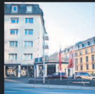
2013 Gorillas and Cars