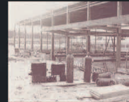
1965 Neubau der heutigen Hauptfiliale in der Hans-Böckler-Straße 13, Neu-Isenburg