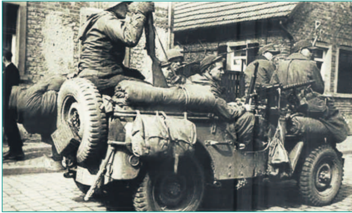
Ein US-Jeep auf seiner Patrouille durch Mainflingen.