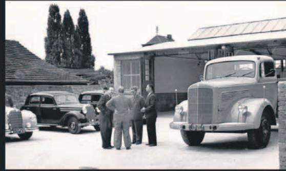
1936 Am 1. Oktober startet offiziell die Zusammenarbeit mit Mercedes-Benz.