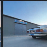
2020 Oldtimer Werkstatt