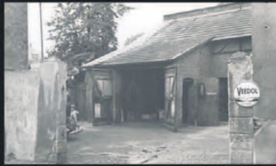
1924 Heinrich und Hildegard Göbel eröffnen Reparaturwerkstatt für Motorräder in der Löwengasse, Neu-Isenburg.