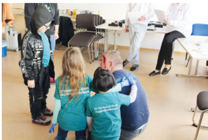
Schon die Jüngsten wissen, dass Erste Hilfe auch heißt, Menschen in Notfällen zu beruhigen, zum Beispiel in dem die Hand auf den Rücken gelegt wird.

Darmstadt (as). Was macht man, wenn bei einem Rollerverstöße eine Person so verletzt ist, dass sie bewusstlos am Boden liegen bleibt? Diese Aufgabe und andere lösten rund 50 Kinder und junge Erwachsene aus Darmstadt und Dieburg beim Kreiswettbewerb des Darmstädter Jugendrotkreuzes (JRK), der am vergangenen Samstag in der Kreisgeschäftsstelle des DRK Darmstadt ausgerichtet wurde. Neben sechs JRK-Gruppen traten auch zwei Gruppen mit Schülerinnen und Schülern der Schulsanitätsdienste (SSD) der Erich-Kästner-Schule, Georg-Büchner-Schule und Justus-Liebig-Schule an. Gegliedert in Bambini, Stufen 1, 2 und 3 mussten sie sich über Erste Hilfe hinaus, in Rotkreuzwissen, Teamwork-, musisch-kulturellen und sozialen Aufgaben messen. Nach sechs spannenden und abwechslungsreichen Stunden standen die Gewinner der Gold- und Silberpokale fest: Gold ging in allen Altersstufen an das JRK Arheilgen. In Stufe 2 wurde außerdem das JRK Zeilhard-Georgenhausen aus dem