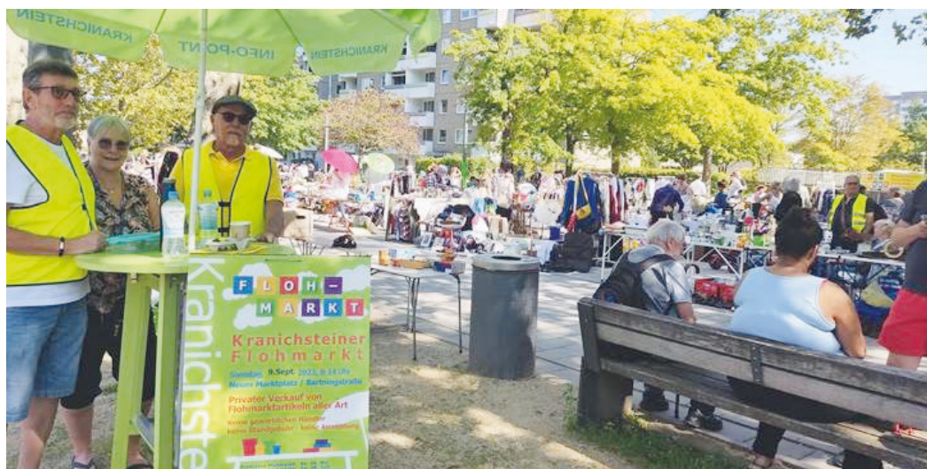
Tolle Stimmung beim Herbstflohmarkt 2023 in Kranichstein.