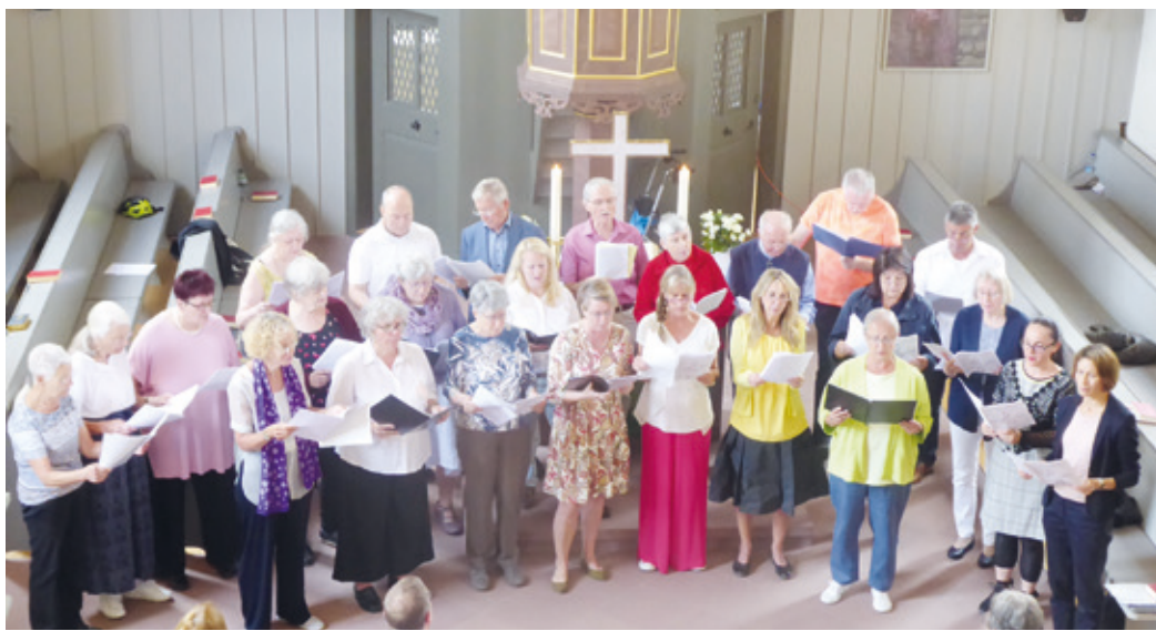
Projektchor am 2. Juli 2023 im Gottesdienst in Wixhausen.