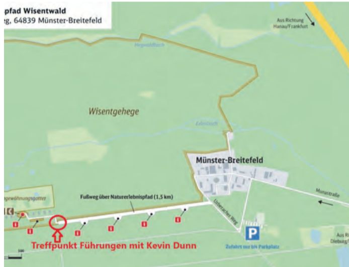
Naturerlebnispfad Wisentwald (Karte: Deutsche Bahn)

(oder per Fahrrad) zurückgelegt werden. Der unbefestigte Weg ist für Rollstühle und Kinderwagen geeignet. Mehrere Mitmachstationen entlang des Wegs laden zu verschiedenen Aktivitäten ein. Eine begrenzte Zahl an Parkplätzen steht am Urberacher Weg zur Verfügung. Es wird jedoch empfohlen, bereits am Freizeitzentrum Münster zu parken.