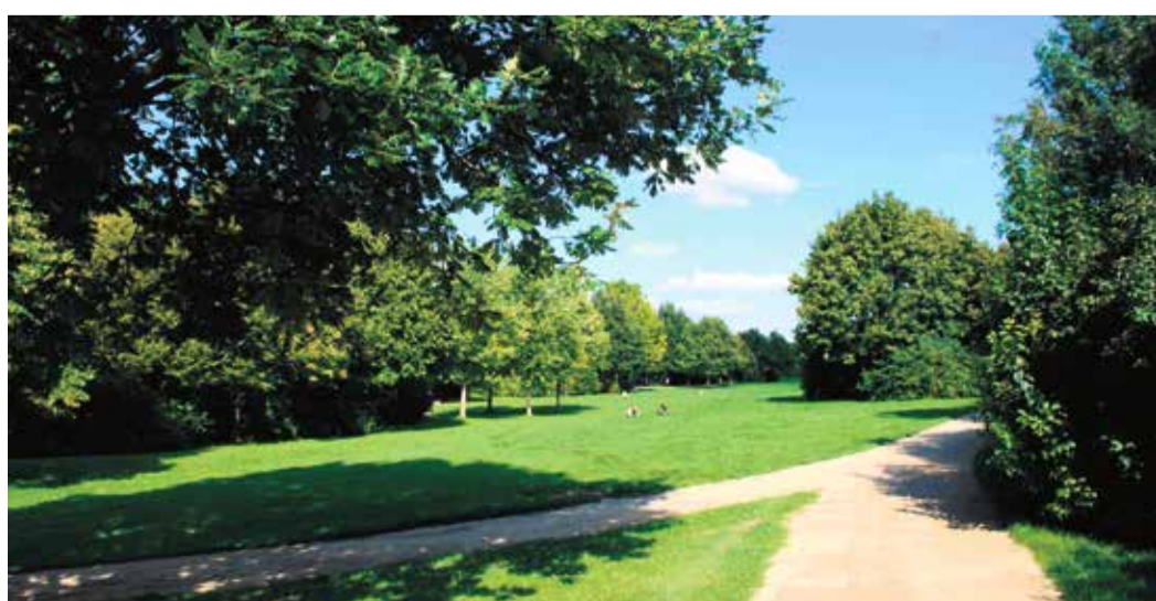
Der Sinai-Park im Frankfurter Stadtteil Dornbusch.

Zustellhotline: Tel. 06104-4970-0 Mo. – Fr. 8.00 – 16.30 Uhr