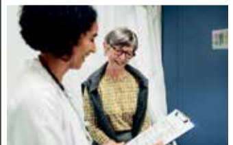
Frauen sollten ihre Herzgesundheit im Blick behalten. Bei Vorhofflimmern haben Frauen ein höheres Risiko, einen Schlaganfall zu erleiden.

Mehr dazu auf www.herzstolpern.de , einer Initiative von Bristol Myers Squibb und Pfizer.