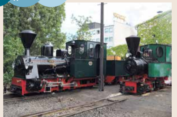
EvaK FOTO: WIKIPEDIA