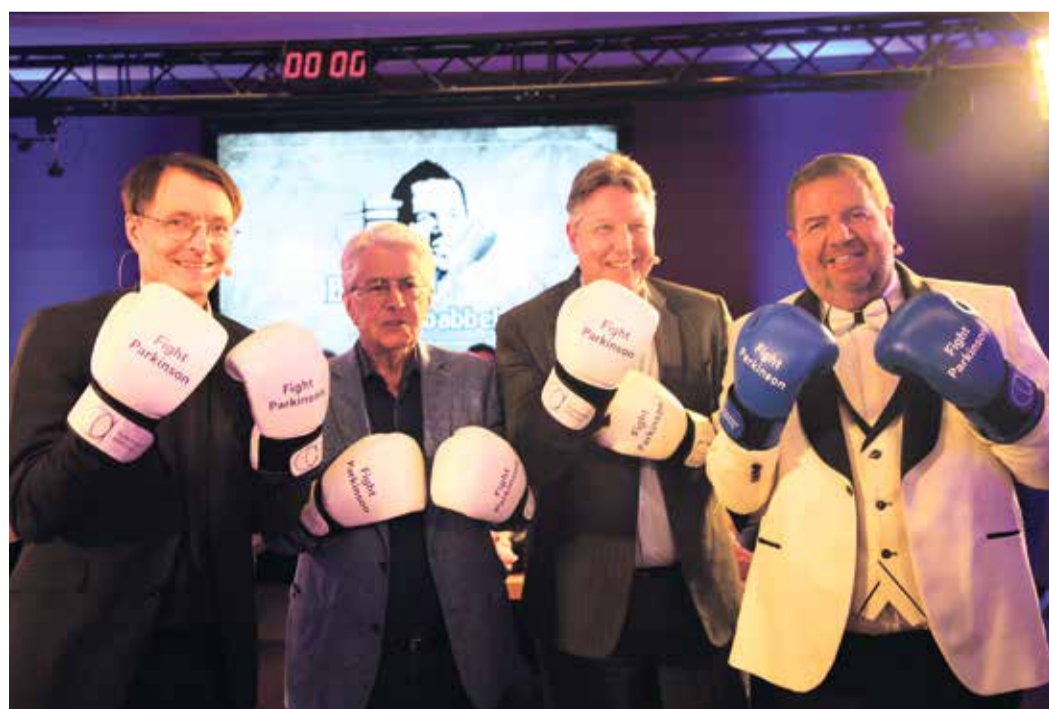
Die Talkrunde hat der Krankheit Parkinson den persönlichen Kampf angesagt. Dabei ist der Sport Boxen sogar schon eine Trainingsempfehlung für Erkrankte.

Veranstaltung, auf die ich mich schon seit Monaten gefreut habe. Wer kann schon behaupten eine der größten deutschen TV-Legenden, unseren Bundesgesundheitsminister und den Chef der Parkinson Stiftung am Tisch sitzen zu haben? Es war toll und wichtig zugleich mit diesen spannenden Persönlichkeiten ins Gespräch zu kommen und gleichzeitig einen Beitrag für die Arbeit der Parkinson Stiftung zu leisten. Alle Einnahmen des Abends konnte ich am Ende der Sendung als Scheck für die Parkinson Stiftung überreichen. Denn das Resümee war einstimmig, dass in Deutschland zu wenig Geld in die Forschung der Krankheit fließt. Umso wichtiger war es auch ein motivierendes Zeichen in die Gesellschaft zu senden.“