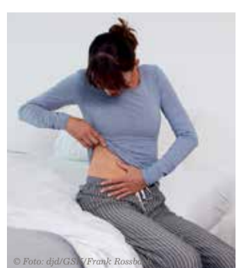
Viele denken, dass es sich bei Gürtelrose vor allem um einen lästigen Hautausschlag handelt - und sind dann von den starken Nervenschmerzen überrascht.

Mehr als 95 Prozent der Erwachsenen haben in ihrer Kindheit eine Windpockenerkrankung durchgemacht und tragen den Gürtelrose-Erreger in sich. Mehr als ein Viertel der Befragten über 50 Jahren glaubt,