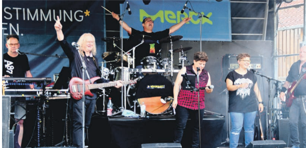
Die Band Witchcraft war unter anderem 2022 beim „Summer Special“ der „River Night“ dabei und tritt bei der zwölften Auflage am 16. März in der Halle des Vereins Radsport am Bahnhof auf.

Dies zeigt sich unter anderem im anhaltenden Verzicht auf Eintritt. Bei den bisherigen zehn Auflagen in der klassischen Form und auch beim „Summer Special“ zum zehnjährigen Bestehen 2022 am Münsterer Bahnhof war nie ein Ticket nötig; Besucher ließen allenfalls dort eine freiwillige Spende da, wo ihnen ein Konzert besonders gut gefiel. Auch diesmal finanzieren vor allem die Gastgeber in den Lokalen die Künstler. Der Getränkeverkauf sorgt zudem dafür, dass auch bei den vier gastgebenden