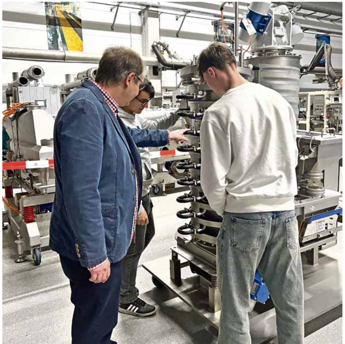
Während „Deine Nacht der Ausbildung“ konnten Jugendliche Unternehmen, hier zum Beispiel die Vibra Maschinenfabrik Schultheis GmbH & Co., kennenlernen und sich dort mit Mitarbeitenden über Ausbildungen und Berufswege austauschen.