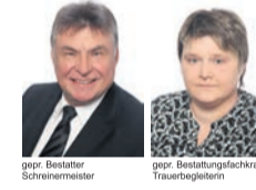
grob. Bestatter Schreinermeister

Pestalozzistraße 4, an der ev. Kirche, 64839 Münster