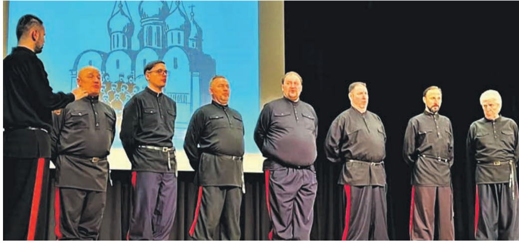
Begeisterten das Publikum in Eppertshausen: Die Sänger des Don Kosaken Chor Serge Jaroff.