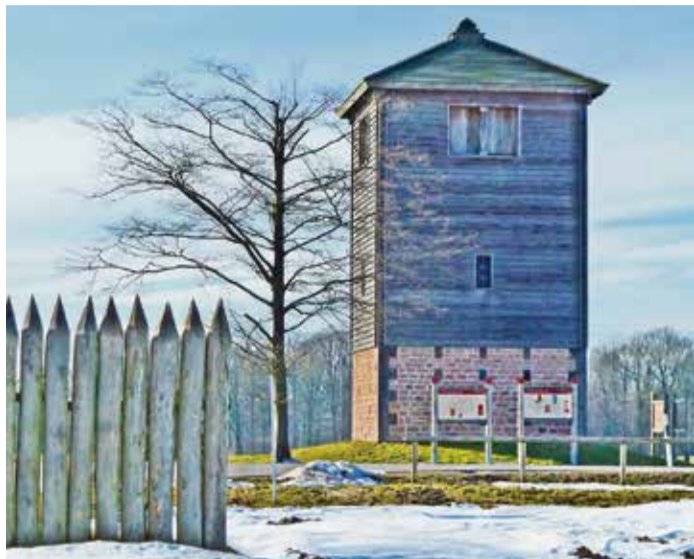
Der Limesturm – hier noch mit Resten von Schnee – ist weithin sichtbares Wahrzeichen von Vielbrunn.

Der östlichste Stadtteil Michelstadts liegt auf dem Höhenzug zwischen Mümlingtal und Mudtal. Die Geschichte der Gegend reicht mindestens bis in die Römerzeit zurück, wovon der deutlich sichtbare Limesturm an der L3349 zeugt.