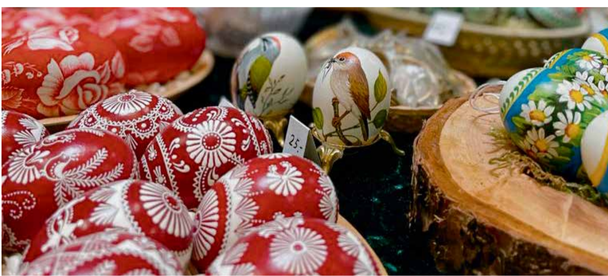
Filigran und mit höchster Präzision gestaltet: So präsentiert sich das Kulturgut Osterei in voller Pracht.

Michelstadt. Farbenprächtige Eier, detailliert und liebevoll bemalt, manche mit Präzision gefräst und in kleine Kunstwerke verwandelt – das bietet der Ostereiermarkt am Samstag, 9., und Sonntag, 10. März in der Erwin-Hasenzahl-Halle am Großparkplatz „Altstadt“. Hier werden einfache Eier zu filigranen Kunstwerken in einer großen, barrierefreien Ausstellung. Die knapp 40 Künstler zeigen auf vielfältige Art und Weise die Gestaltung des Eies. Verzierte Hühner-, Gänse-, Enten-, und die großen Straußeneier sind gefragte Sammelobjekte. Techniken wie ausgefräste Eier, mit Scherenschnitten beklebte Eier, Ätz- und Gravurtechniken, Batikeier, Collagen aus Stickereien, Spitzen und Gräsern, Ölfarben oder Aquarellfarben bemalt, Tuschezeichnungen und vieles mehr können von den Besuchern bewundert