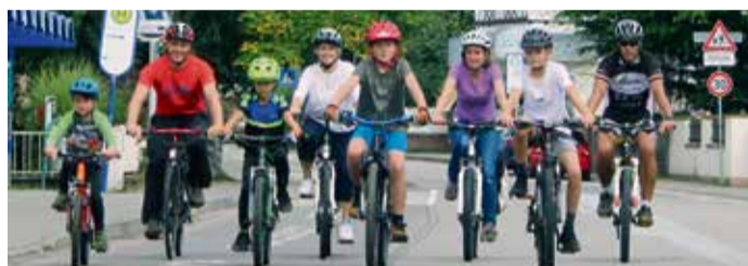
2023 radelten die Teilnehmer in Michelstadt mehr als 60.000 Kilometer.

Michelstadt. Am Freitag, 3. Mai, fällt der Startschuss für das Schul- und Stadtradeln 2024. Drei Wochen lang treten die Odenwälder wieder verstärkt in die Pedale. Die Auftaktveranstaltung findet an der Stadtschule in Michelstadt statt. Ein Technikparcours, ein Fahrradsicherheitscheck und weiteres wird für Radfahrer zur Verfügung stehen. Das Organisationsteam Schulradeln – bestehend aus Vertretern des Beruflichen Schulzentrums Odenwaldkreis, der Einhardsschule, des Gymnasiums Michelstadt, der Schule am Hollerbusch, der Stadtschule, der Theodor-Litt-Schule (alle Michelstadt), der Astrid-Lindgren-Schule und der Schule