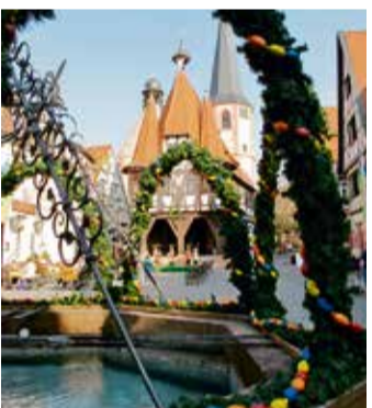
Österlich geht es bei den Führungen in Michelstadt zu.

Michelstadt. Ab Mitte März lädt die Stadt zu einer Entdeckungsreise ein: Stadtführungen, die sich ganz dem Thema Ostern und der vorangegangenen Fastenzeit widmen.