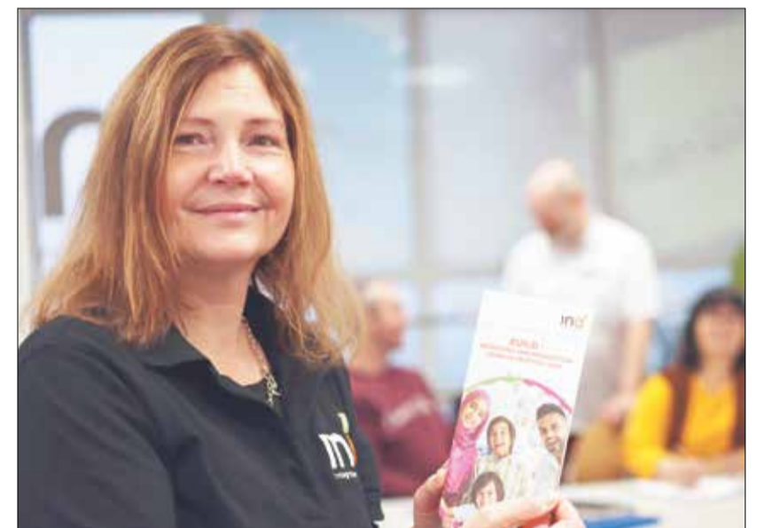
Das Ziel von „BuILD“ ist die Anerkennung der beruflichen und schulischen Qualifikationen der Kursteilnehmenden. Dadurch soll ihnen eine schnellere Ausbildungs- oder Arbeitsaufnahme in einem passenden Berufszweig in Deutschland ermöglicht und so gleichzeitig die Integration weiter gefördert werden.

Hilfe im Bewerbungsprozess und Unterstützung für Zugewanderte und Geflohene