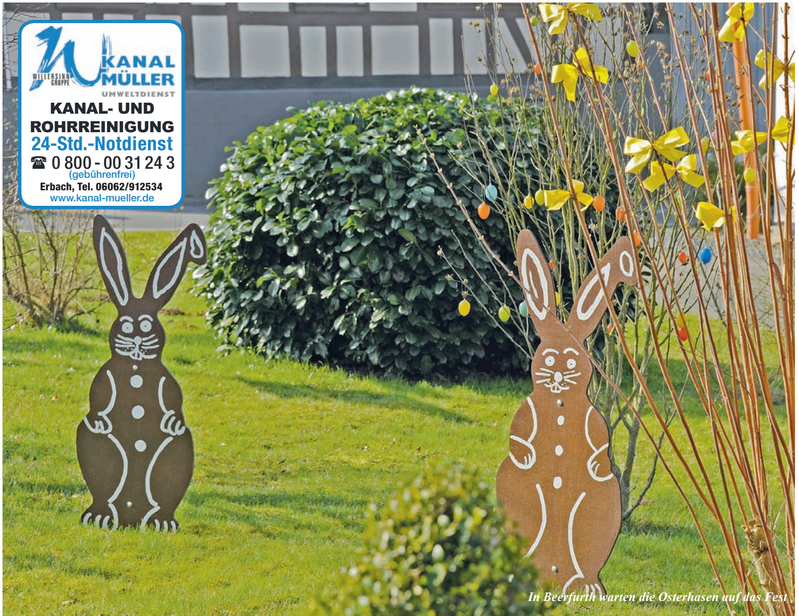
In Beerfurth warten die Osterhasen auf das Fest