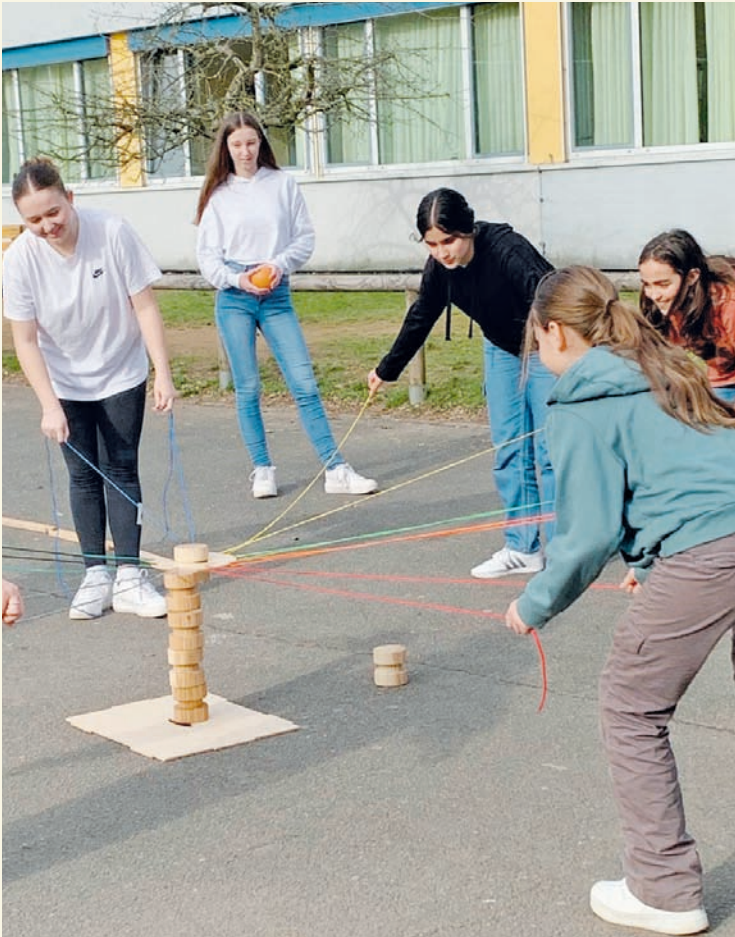
Die Austauschstudenten machten auch Sport.