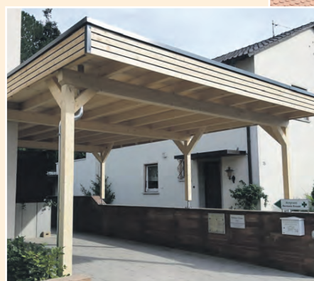
« Carports sowie Überdachungen von Stellplätzen und Eingängen