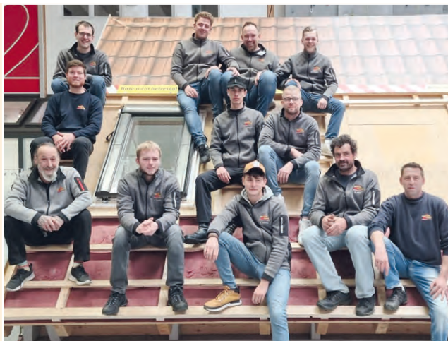
Jährliche Fortbildungen in Material und Einbau stehen bei Martin + Bach GmbH & Co auf der Tagesordnung (auf dem Foto sind nicht alle Mitarbeiter anwesend)