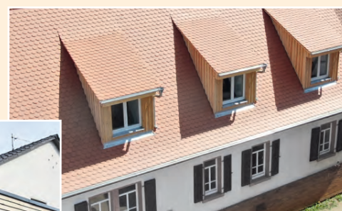
» Steildach mit Biberschwanzeindeckung