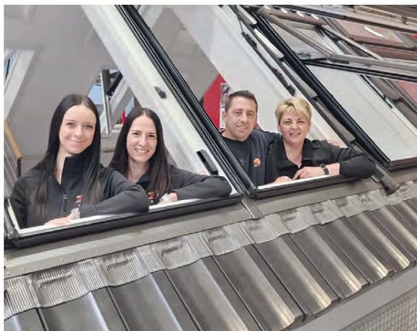
Das Team im Büro von Martin + Bach GmbH & Co steht für einen reibungslosen Ablauf der Anliegen und Wünsche der Kunden zur Verfügung.