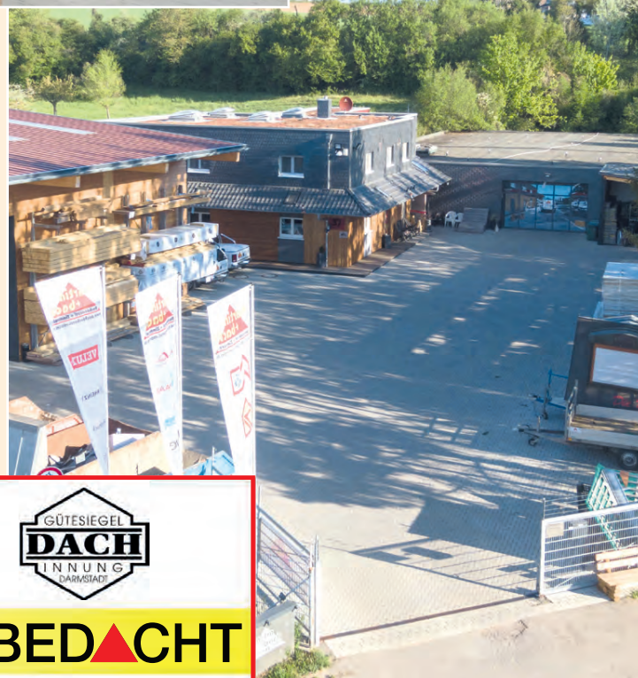
Das Firmengelände der Dachdeckerei + Zimmerei Martin und Bach GmbH & Co im Ober-Ramstädter Weg 37 in Reinheim.