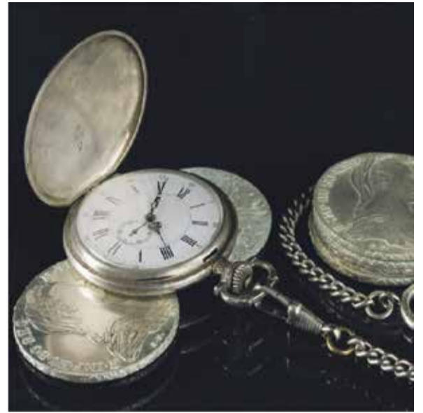
Taschenuhr und Silbermünzen

Berliner Straße 66 (am Theatertunnel) 60311 Frankfurt Innenstadt Tel. 01578 5072282