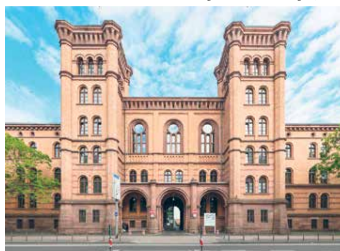
Das imposante Backsteingebäude - die Gutleutkaserne