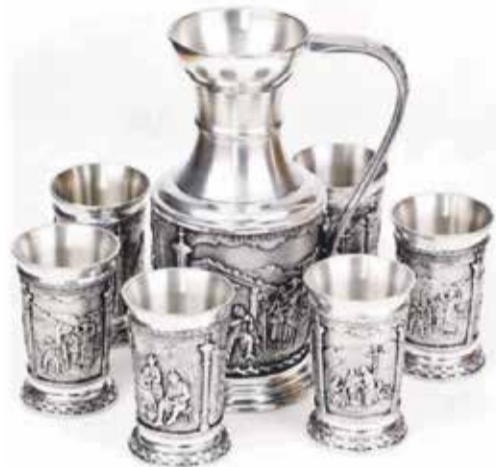
Zinnkrug und Zinnbecher