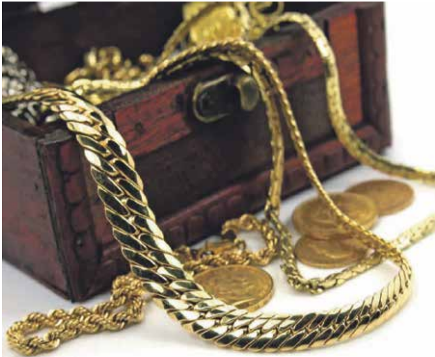
Goldschmuck und Goldmünzen

Experten für Schmuck, Diamanten, Luxusuhren und Bernstein vom 25. bis 30. März 2024 in der Frankfurter Innenstadt zu Gast