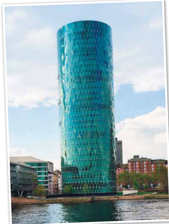
„Das große Gerippes“ - der Westhafentower

Unter der Friedensbrücke verbirgt sich ein kleiner, aber actionreicher Skatepark, der im Jahr 2021 erweitert und renoviert wurde. Ausgestattet mit einer Vielzahl von Rampen, Hindernissen und anderen Elementen, bietet dieser Park eine großartige Alternative zum größeren Skatepark im Ostpark. Egal, ob Sie ein erfahrener Skater sind oder gerade erst anfangen, hier