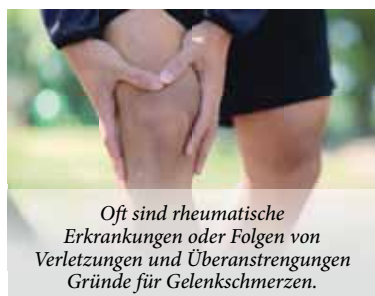
Oft sind rheumatische Erkrankungen oder Folgen von Verletzungen und Überanstrengungen Gründe für Gelenkschmerzen.

Was meist mit einem leichten Ziehen z. B. im Knie beginnt, kann sich bald zu einem anhaltenden Schmerz weiterent-