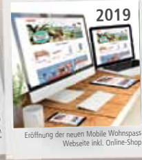
Eröffnung der neuen Mobile Wohnspass Webseite inkl. Online-Shop