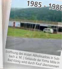
Eröffnung des ersten Abholmarktes in Sulzbach a. M. | Gebäude der Firma Möla in Bad König wird durch Kauf übernommen