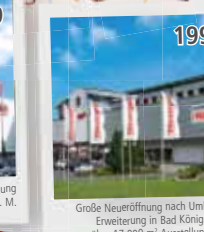
Große Neueröffnung nach Umbau und Erweiterung in Bad König-Zell mit über 17.000 m 2 Ausstellungsfläche