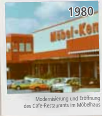
Modernisierung und Eröffnung des Café-Restaurants im Möbelhaus