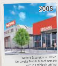
Weitere Expansion in Hessen. Der zweite Mobile Mitnahmemarkt wird in Egelsbach eröffnet