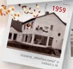
Gründung „Möbelhaus Kempf“ in Sulzbach a. M.