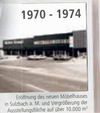
Eröffnung des neuen Möbelhauses in Sulzbach a. M. und Vergrößerung der Ausstellungsfläche auf über 10.000 m 2