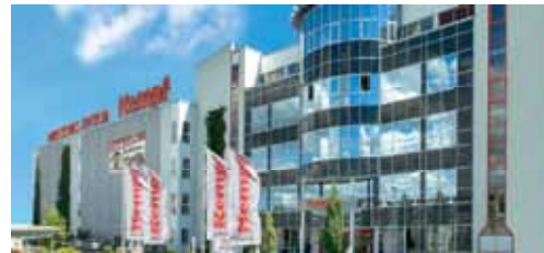
1999 Baubeginn Möbel Kempf in Aschaffenburg. 150 neue Mitarbeiter, 30.000 m 2 Verkaufsfläche. Neueröffnung nach Rekordbauteit am 27. Juli 2000

Wir möchten der jungen Generation einen starken Einstieg ins Berufsleben ermöglichen, indem wir viele verschiedene, spannende Arbeitsplätze mit Aufstiegsmöglichkeiten bieten. Das Ausbildungsangebot von Möbel Kempf und Mobile Wohnspass umfasst dreizehn Berufe und ein dua-