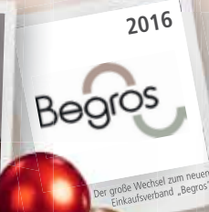
Der große Wechsel zum neuen Einkaufsverband „Begros“