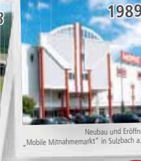
Neubau und Eröffnung „Mobile Mitnahmemarkt“ in Sulzbach a. M.