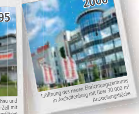
Eröffnung des neuen Einrichtungsraums in Aschaffenburg mit über 30.000 m 2 Ausstellungsfläche