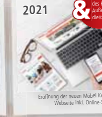
Eröffnung der neuen Möbel Kempf Webseite inkl. Online-Shop