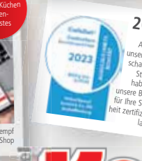
Aufgrund unserer wirtschaftlichen Stabilität haben wir unsere Bonität für Ihre Sicherheit zertifizieren lassen