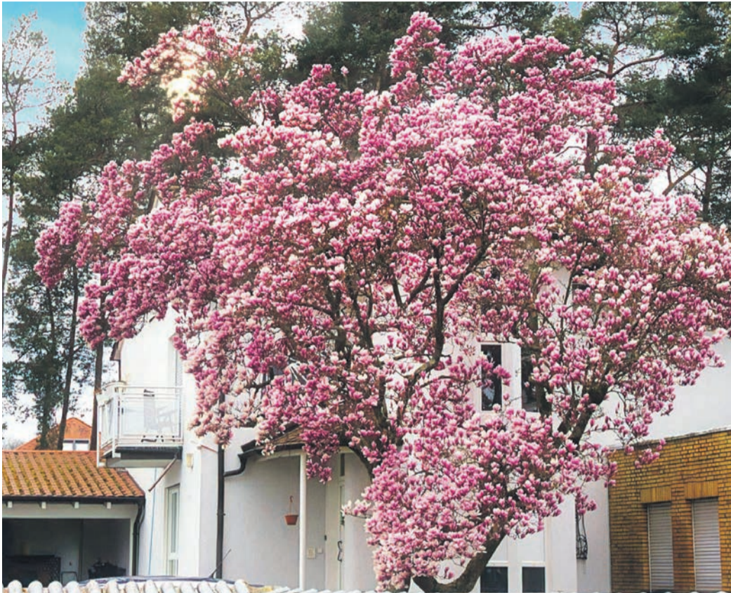
Und Frühlingszeit ist Blütezeit: Eine prächtige Magnolie hat unser Fotograf in Obertshausen gefunden.

Im alten Ägypten und Persien etwa war es Brauch, bemalte Eier als Frühlingsgeschenke auszutauschen, was auf die Anerkennung des Eies als Symbol des Lebens und der Wiedergeburt hindeutet. Diese Praxis könnte sich später in Europa verbreitet haben. Auch in der römischen Kultur galt das Ei als Symbol des Lebens und der Wiedergeburt, was ebenfalls zur Bildung der Ostertradition beigetragen haben könnte. Mit der Ausbreitung des Christentums in Europa wurde das Osterie in die christliche Symbolik integriert. Ostern, das die Auferstehung Jesu Christi feiert, fand oft zeitgleich mit den vorchristlichen Frühlingsfesten statt. Das Ei, als Symbol der Wiedergeburt, wurde somit zu einem natürlichen Symbol für die Auferstehung und das neue Leben. Im Mittelalter schließlich wurde das Färben und Schenken von Eiern zu Ostern in der christlichen Tradition immer beliebter. Eine weit verbreitete Erklärung für die Verwendung gefärbter Eier ist