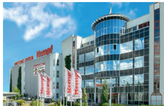
1999 Baubeginn Möbel Kempf in Aschaffenburg. 150 neue Mitarbeiter, 30.000 m 2 Verkaufsfläche. Neueröffnung nach Rekordbauzeit am 27. Juli 2000

verschiedene, spannende Arbeitsplätze mit Aufstiegsmöglichkeiten bieten. Das Ausbildungsangebot von Möbel Kempf und Mobile Wohnspass umfasst dreizehn Berufe und ein duales Studium an vier möglichen Standorten. Auch der relativ neue Ausbildungsberuf zum Kaufmann oder zur Kauffrau im E-Commerce ist dabei. Wir fördern individuelle Talente und Interessen