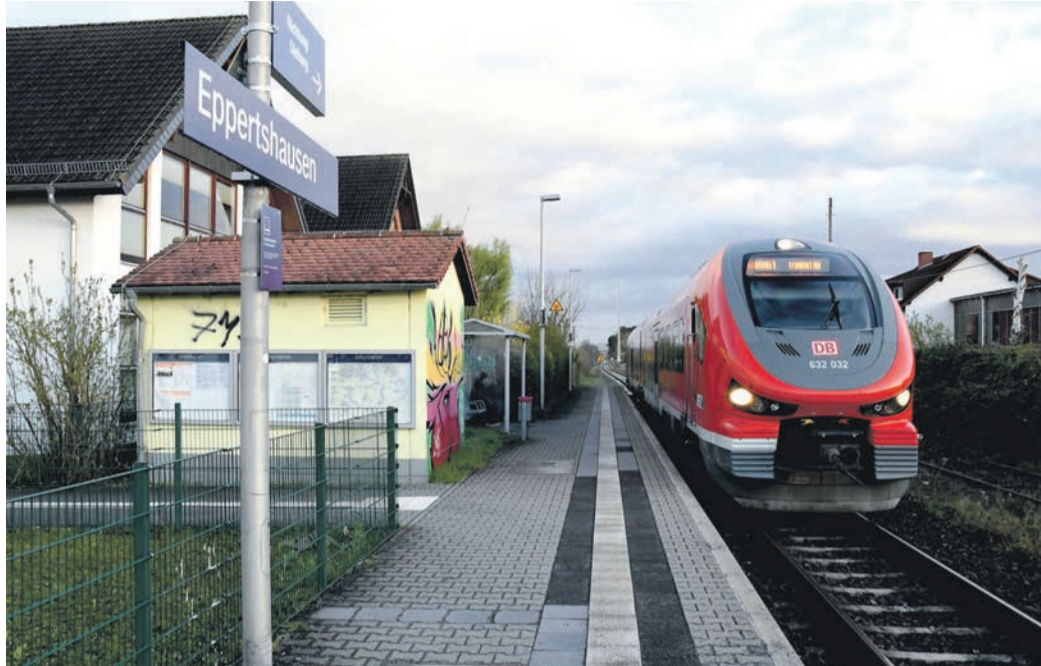
Die Regionalbahn 61 fährt von Münster kommend am Eppertshäuser Bahnhof ein. Dies geschieht derzeit nur einmal stündlich und soll künftig alle 30 Minuten der Fall sein.

Die zentrale Maßnahme, die den halbständigen Ein- und Ausstieg in Eppertshausen (und damit auch an den weiter südlich gelegenen Bahnhöfen