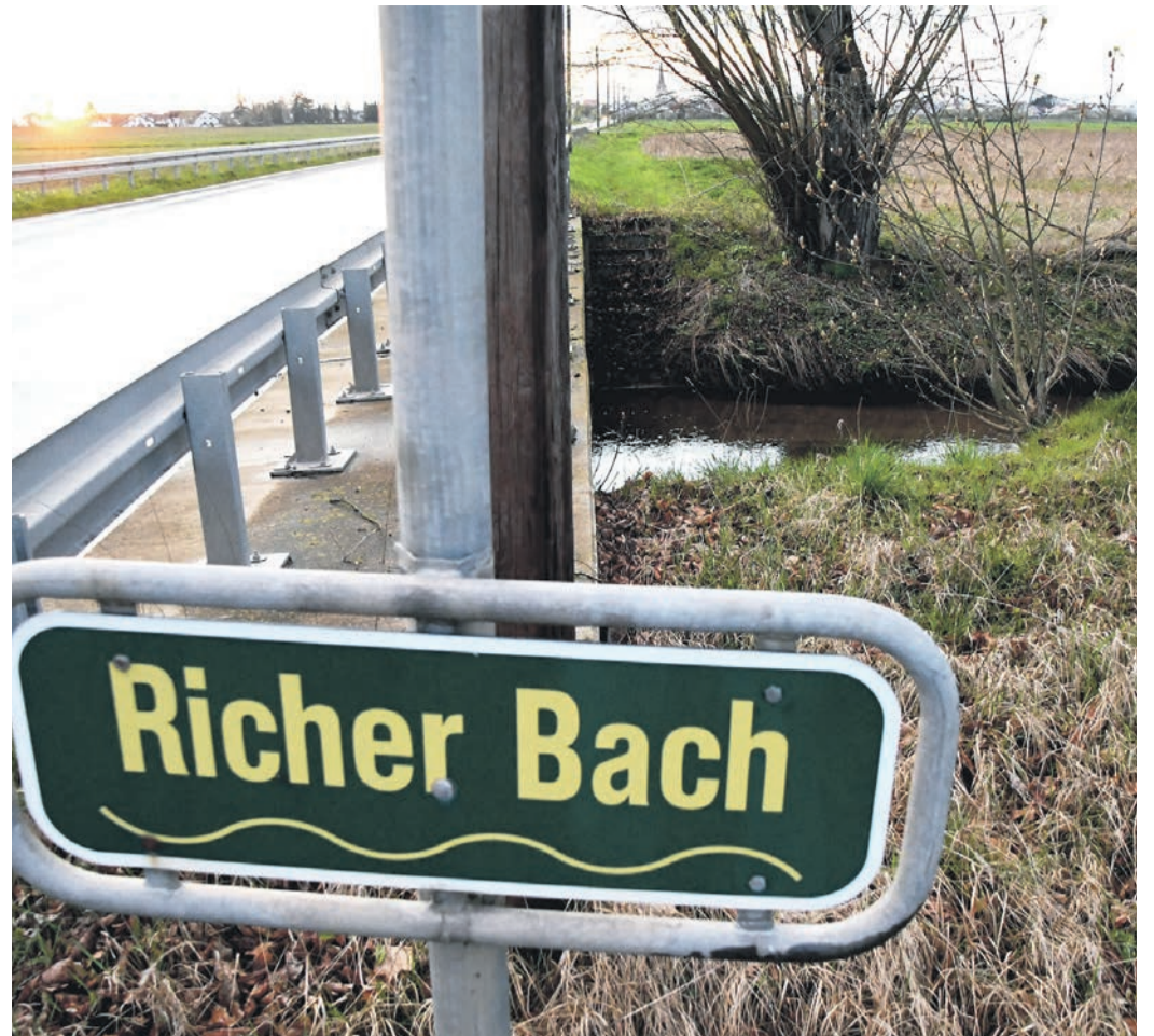
Der Richer Bach soll zwischen Altheim und Harpertshausen breitere Uferand-Streifen bekommen, die nicht mehr bewirtschaftet werden dürfen. Dafür ist ein Flurbereinigungs-Verfahren mit Grundstücks-Tauschen nötig. Links im Bild: die L3095, die Altheim und Richen verbindet.