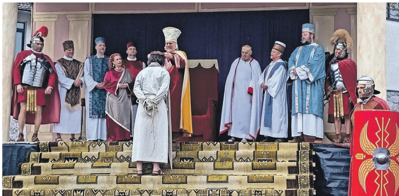
Herodes setzt Jesus die Dornenkrone auf.

Mit seinem Auftritt stand Fuchs in der Tradition einiger großer Regisseure, die in ihren Stücken und Filmen einen Kurzeinsatz pflegten. Und Gläubigen, die gerade an Ostern das Leid Christi ein wenig am eigenen Körper erfahren wollen.