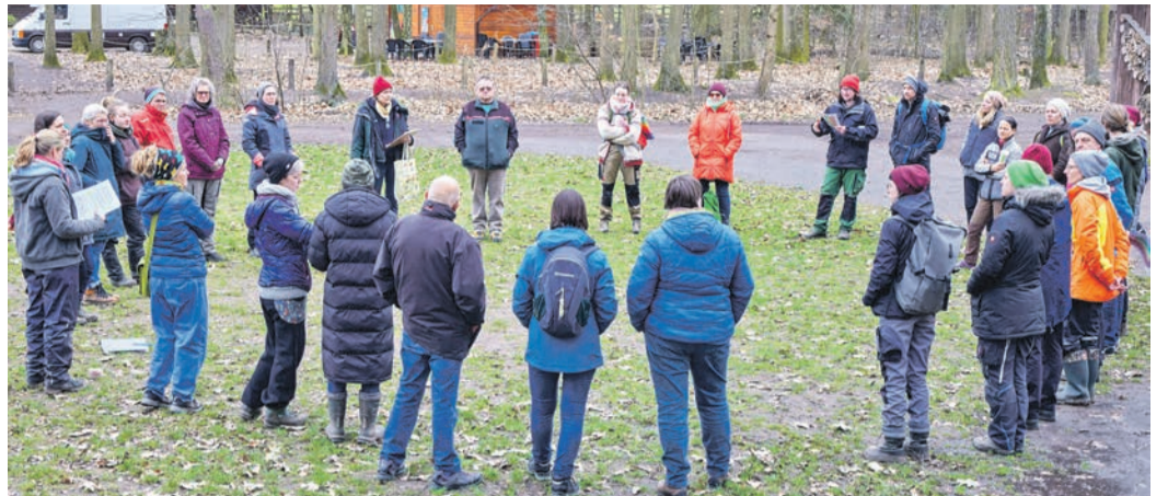
Erzieherinnen und Erzieher der Waldkindergärten der AWO Obertshausen beim Waldsicherheitstraining im Wildpark Alte Fasanerie in Klein-Auheim.

Rettings-App „Hilfe im Wald“, die bereits vor über 20 Jahren in Hessen entwickelt worden sei und inzwischen europaweit eingesetzt werde. Damit könne im Unglücksfall schnell der nächstgelegene Rettungsdienst, Feuerwehr sowie die Polizei könnten an die entsprechende Stelle angefordert werden.