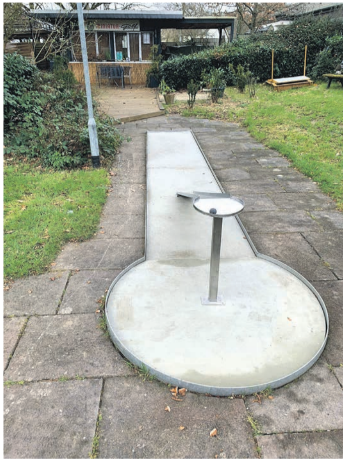
Die Sanierung der Minigolfanlage an der Gumbertseestraße ist abgeschlossen.

Obertshausen (NZO) Am vergangenen Sonntag war Saisonöffnung am Hausener Minigolfplatz an der Gumbertseestraße neben dem Bürgerhaus. Dazu kann das städtische Team aus dem Fachdienst Landschaft und Spielraum verkünden, dass die Sanierung der Minigolfplatzbahnen erfolgreich abgeschlossen werden konnte. Und so dürfen sich die Nutzerinnen und Nutzer auf noch mehr Spielspaß bei der Jagd nach den Punkten freuen. Seit Januar 2022 wurden alle 18 Bahnen inklusive Hindernisse abschnittsweise auf Vordermann gebracht und fachmännisch saniert - auch der Unterbau und anliegenden Flächen wurden entsprechend an die neuen Gegebenheiten angepasst. „In Teilen wurde zur Attraktivitätssteigerung der Anlage neue Designs an Hindernissen verbaut“, erklärt Fachdienstleiterin Corinna Pestka. Ebenfalls seien neue Bahnnummern, Abschlagbleche und Trittbleche eingebaut. Ebenfalls ein kleiner Sandkasten, ein Pavillon auf dem Terrassendeck sowie eine Rollstuhlrampe gehören seit 2023 zur neuen Anlage und die Lampen sind auf LED umgestellt. Ebenfalls hat die Stadt wieder neue Schläger, Schlägerständer, Bälle und Blöcke zum Saisonstart bestellt. Die Verjüngungskur hatte die Anlage, die aus den 1970er