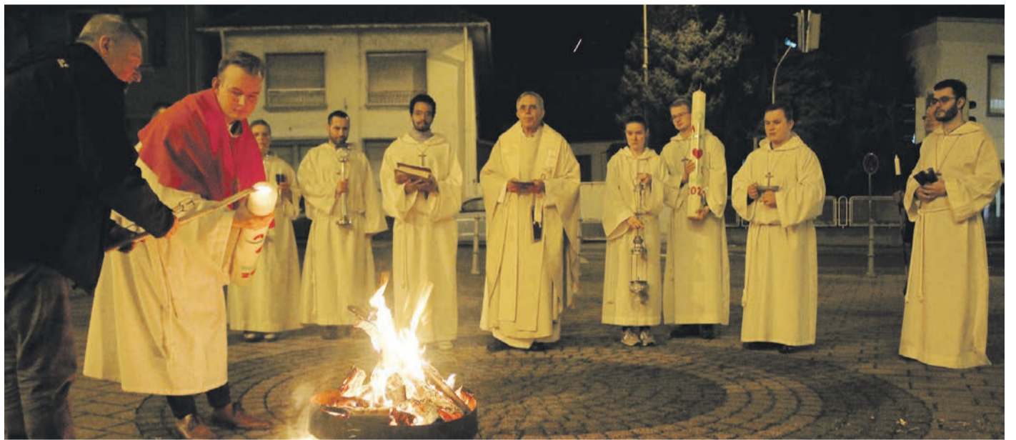
Mit der Segnung des Osterfeuers und dem Entzünden der Osterkerze vor der Basilika Herz Jesu begann für die katholischen Pfarreien in Obertshausen die Feier der Osternacht.

Weitere Infos über das Konzept der Wald- und Naturkindergärten sowie über freie Plätze gibt es bei der AWO Obertshausen, Birkenwaldstraße 38. Telefon: 06104 95364436.