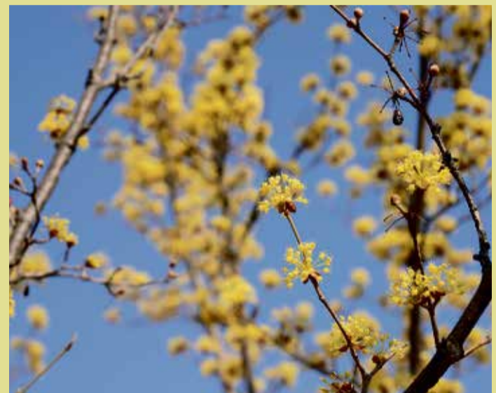
Die Kornelkirsche gehört zu den Frühblühern.

Mit diesen Tipps und einem liebevollen Blick auf die Bedürfnisse des Gartens steht einem gelungenen Start in die Gartensaison nichts mehr im Wege.