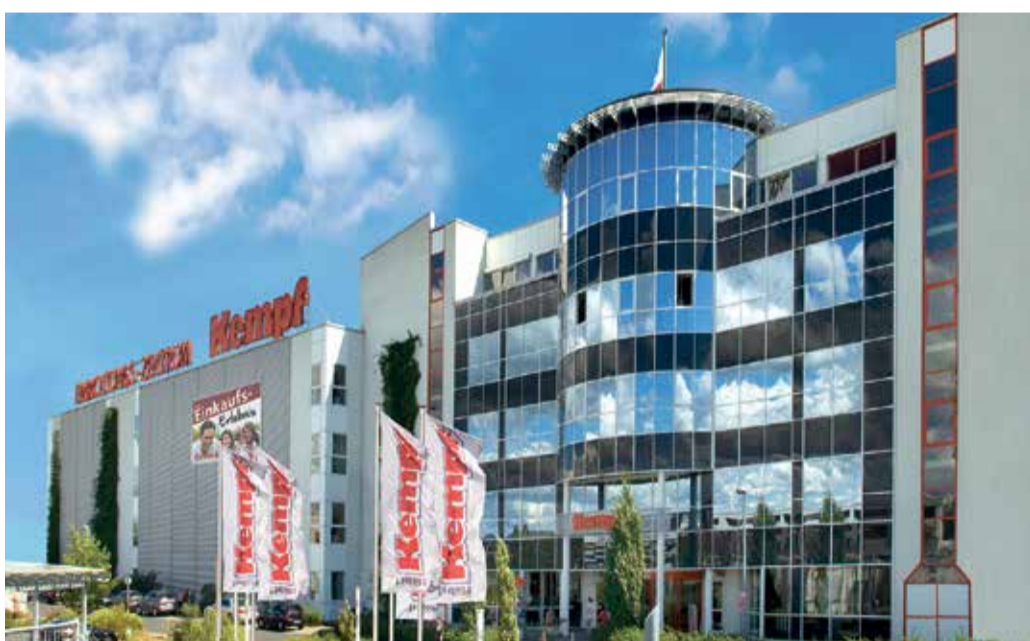
Moderne Glasfassaden, Wohnräume im Inneren: Möbel Kempf in Aschaffenburg.