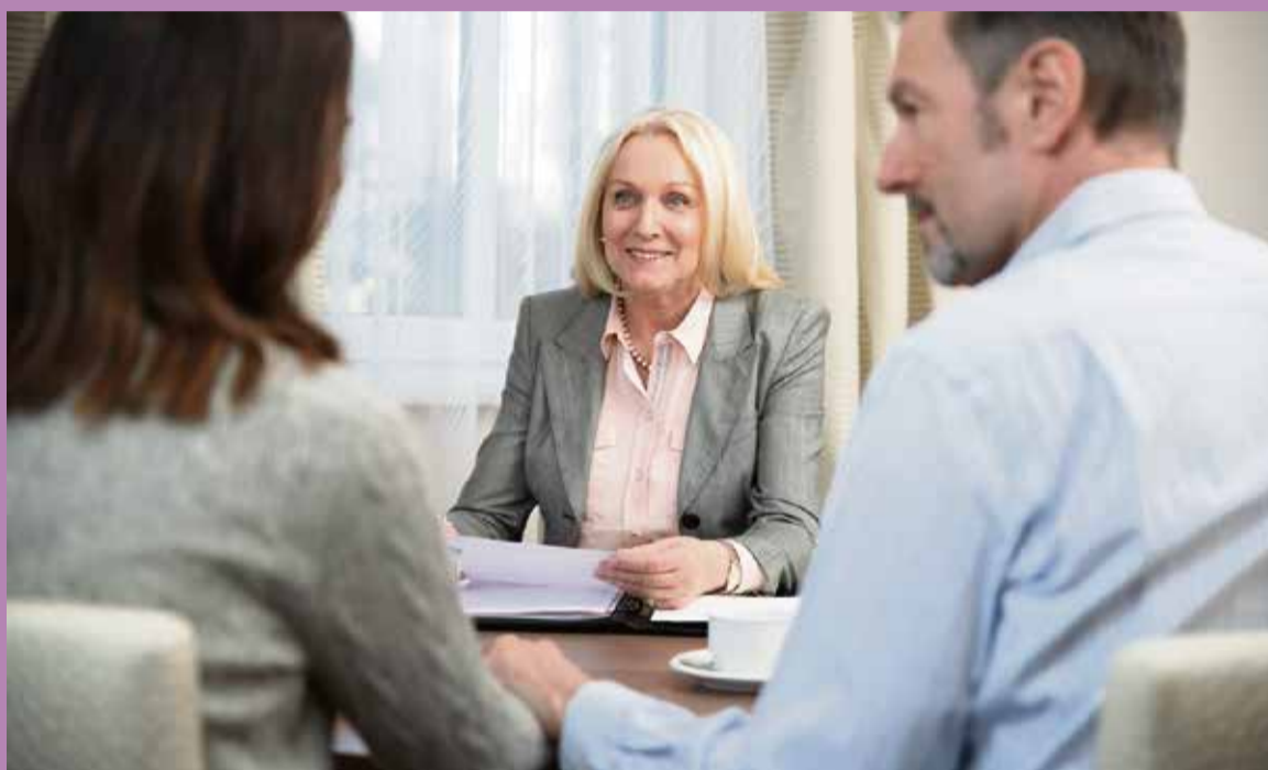
Die Liebsten entlasten und selbst auf der sicheren Seite sein mit einem Bestattungsvorsorgevertrag.

Gerade in Zeiten zunehmender Pflegebedürftigkeit ist eine sichere Hinterlegung des Geldes für die Bestattung wichtig. Viele Menschen sind der Ansicht, dass für die Bezahlung der Bestattung das Sparbuch ausreichend sei. Von einem Sparbuch auf den Namen des Vorsorgenden als Bestattungsvorsorge kann jedoch nur abgeraten werden, da die Gelder damit nicht „zweckgebun-