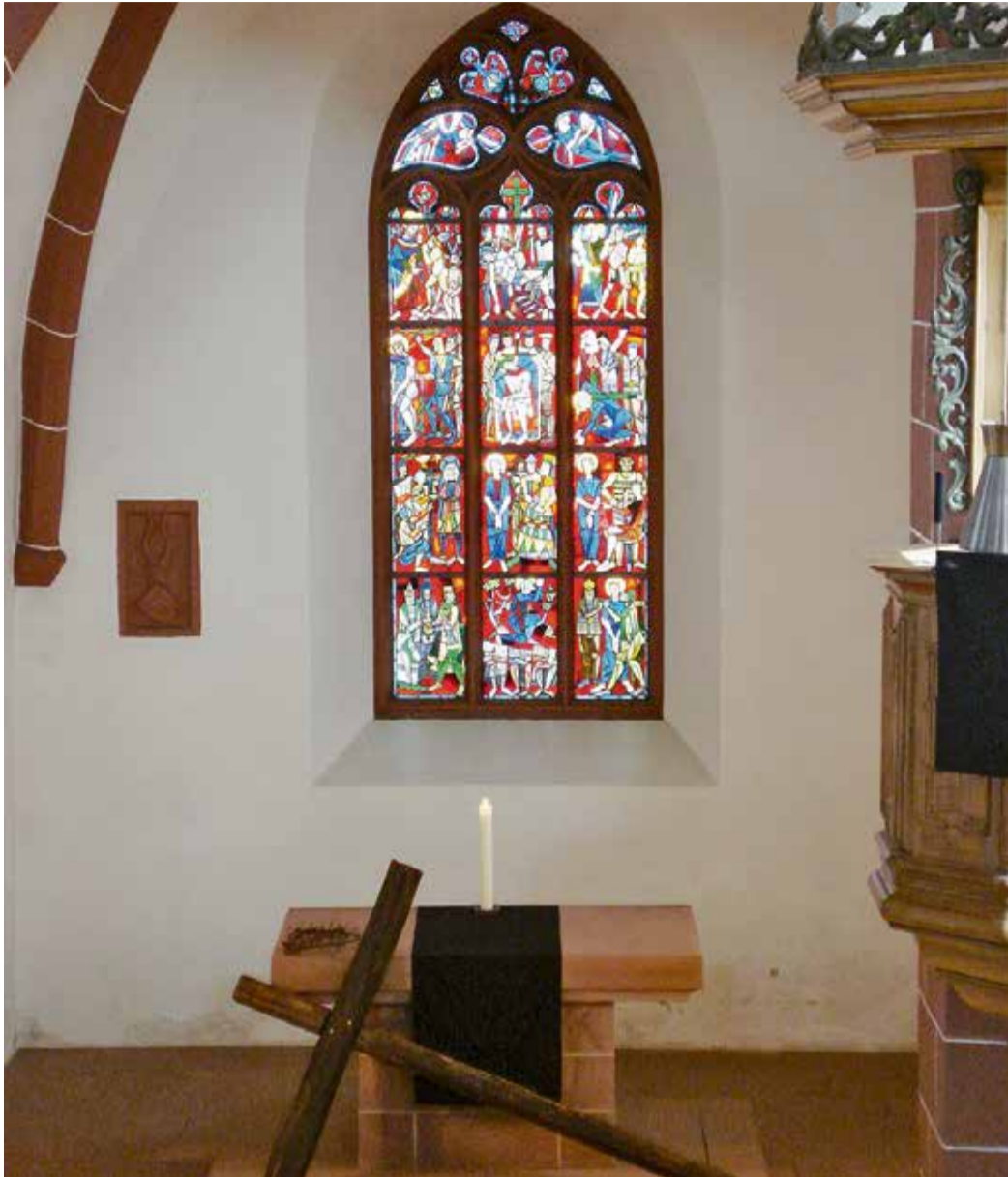
Text und Konzert in der Kirche.