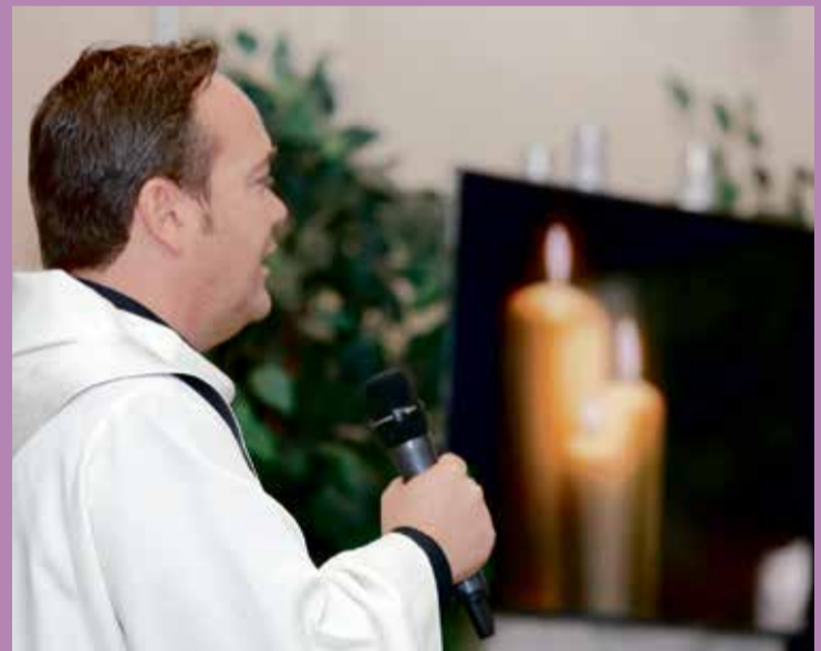
Ein Prediger kann das Gedenken an den Verstorbenen in Worte fassen.

Kerze anzuzünden oder an einen vertrauten Ort zu gehen. • Abschied von alten Gegenständen, wenn das möglich ist. Vielleicht wandern die Dinge erst einmal in eine Kiste, später in den Keller – Abschied braucht Zeit. Mit einer sogenannten Bestattungsverfügung lässt sich zu Lebzeiten verbindlich festlegen, wo und wie die eigene Beerdigung stattfinden soll. Dies kann den Hinterbliebenen in der Zeit der Trauer helfen und den Abschied etwas leichter machen.