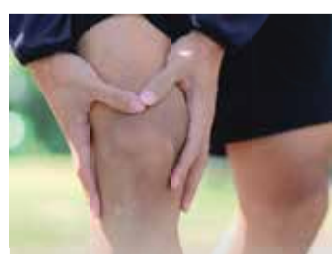
Oft sind rheumatische Erkrankungen oder Folgen von Verletzungen und Überanstrengungen Gründe für Gelenkschmerzen.

Was meist mit einem leichten Ziehen z.B. im Knie beginnt, kann sich bald zu einem anhaltenden Schmerz weiterentwickeln – vor allem bei Bewegung oder Belastung der Gelenke. Die Folge: Schmerzgeplagte be-