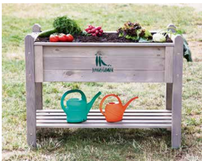
Bereit zum Bepflanzen: Hochbeete werden für Kindergartenkinder aufgestellt.

Michelstadt. Die DEVK und „Junges Gemüse“ starten zusammen ein Projekt, bei dem bundesweit Hochbeete an Kindertagesstätten eingerichtet und bepflanzt werden.