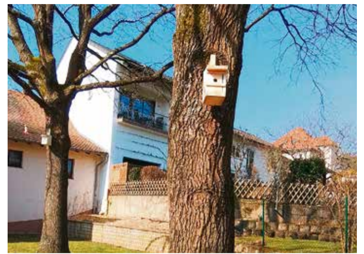
Schon hängen sie, die Vogelhäuschen, die zum Selberbauen gespendet wurden.

Eine neue Hängehöhle zum Ausruhen und Zurückziehen, ein Indoortrampolin zum Hüpfen und Austoben und ein Puppenhaus für das kreative Spielen. Vogelhäuschen zum Selberbauen gab es auch noch – die Kinder haben diese bereits zusammengebaut, diese sind in den Bäumen am Bürgerhaus in Steinbach angebracht. red