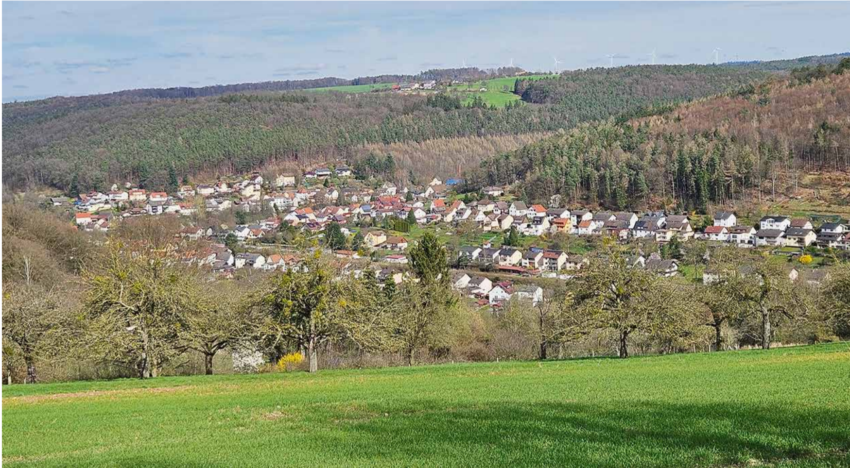
Beschaulich von der Ferne, aus nächster Nähe voll pulsierendem Leben: Das ist Bad König/Zell.