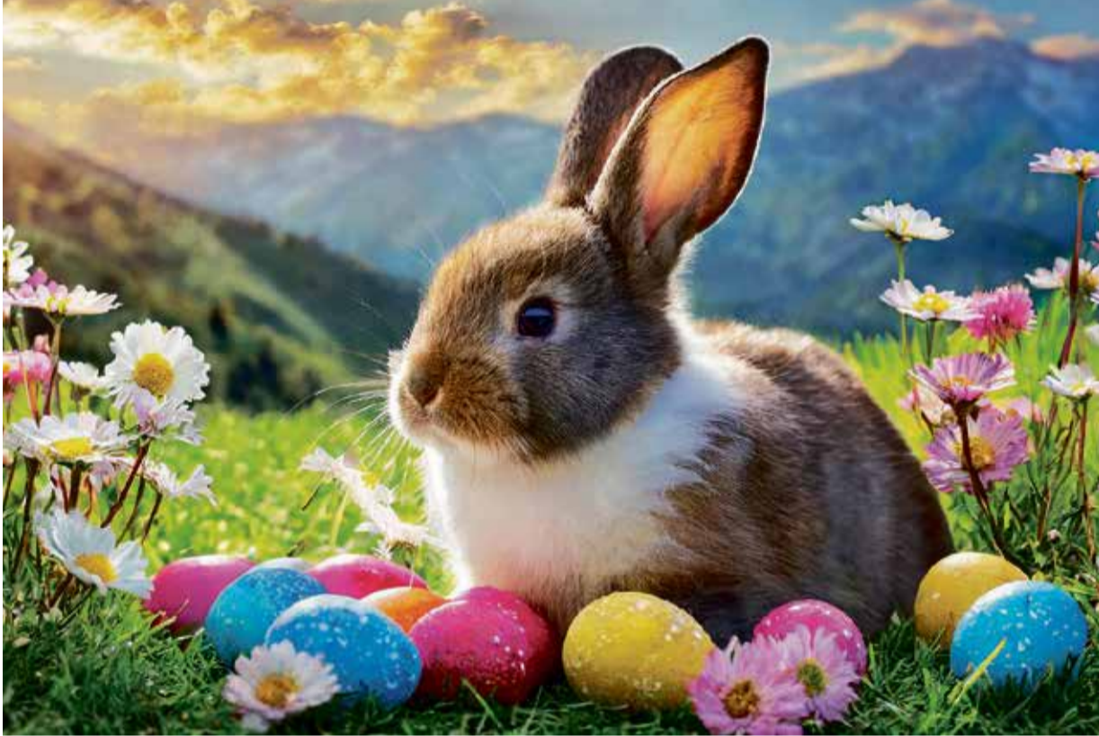
Frohe Ostern: Mit den Symbolen des Lebens geht es in den Frühling.

Das Odenwälder Journal wünscht schöne Feiertage