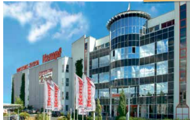
1999 Baubeginn Möbel Kempf in Aschaffenburg. 150 neue Mitarbeiter, 30.000 m² Verkaufsfläche. Neueröffnung nach Rekordbauzeit am 27. Juli 2000

möglichen, indem wir viele verschiedene, spannende Arbeitsplätze mit Aufstiegsmöglichkeiten bieten. Das Ausbildungsangebot von Möbel Kempf und Mobile Wohnspass umfasst dreizehn Berufe und ein duales Studium an vier möglichen Standorten. Auch der relativ neue Ausbildungsberuf zum Kaufmann oder zur Kauffrau im E-Commerce ist dabei.