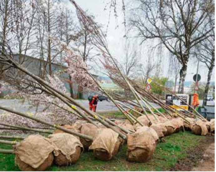
In den nächsten Tagen werden 64 neue Bäume an der B45 gepflanzt.

und des Asphalts vor Wurzeln wird ein größerer Abstand zum Bordstein eingeplant. Die Gesamtinvestition der Neupflanzung beträgt 42.000 Euro. red