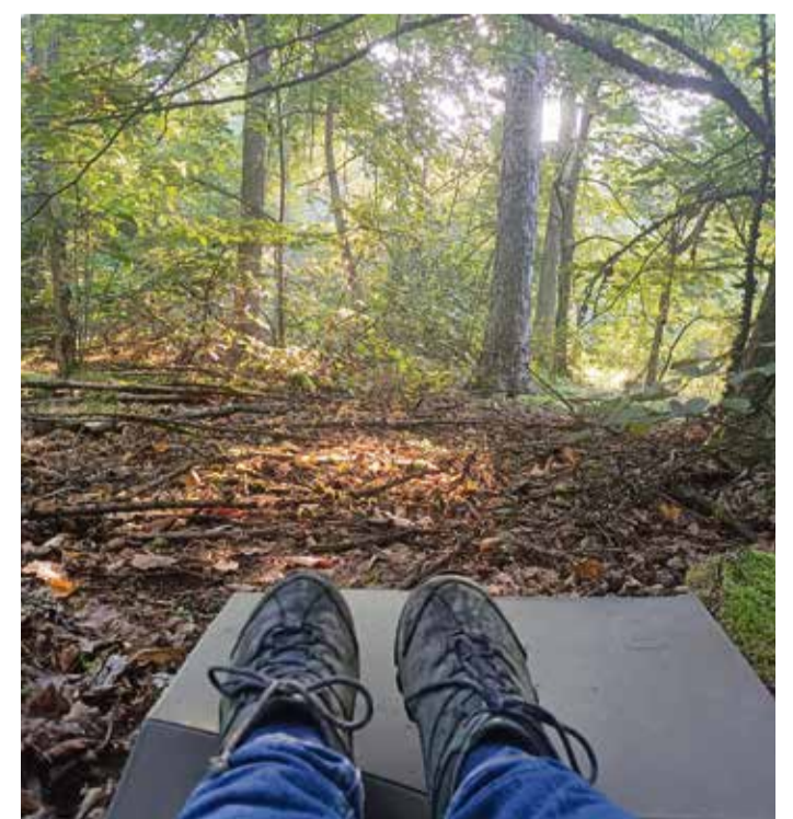
Der Wald hat einen Einfluss auf die Gesundheit.