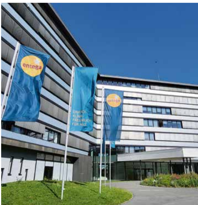
Die Hauptverwaltung der ENTEGA AG in Darmstadt in der Frankfurter Straße.

Die Teilnahme kostet 3 Euro pro Person, Anmeldung unter: anmeldung@michelstadt.de oder Tel.: 06061-74620. red