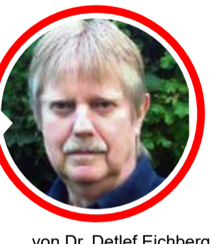
von Dr. Detlef Eichberg

eine antioxidative Wirkung verantwortlich sind. Daher wird Aronia in der Volksheilkunde gegen oxidativen Stress und gegen die schädliche Wirkung freier Radikale empfohlen, was vorbeugend gegen Krebserkrankungen wirksam sein kann. Auch bezüglich degenerativer Herz-Kreislauf-Erkrankungen macht Aronia aufgrund einer Verbesserung der Elastizität von Blutgefäßen als empfehlenswerte Komponente in der Nahrungsergänzung Sinn. Des Weiteren wird der Apfel-Beere auch eine vorbeugende Wirkung gegen eine eventuell drohende Degeneration der Macula am Auge in seriösen Studien zuerkannt. Und schließlich scheint aufgrund einer stark adstringierenden, d.h. Schleimhautstärkenden Wirkung, ein Einsatz bei Magen-Darm-Erkrankungen angebracht. Bei alledem sind die Kosten für einen Extrakt in Kapselform durchaus erschwinglich.