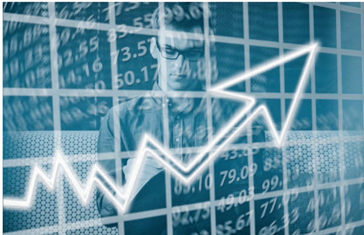
Die Arbeitslosenquote liegt im Odenwaldkreis stabil bei fünf Prozent.