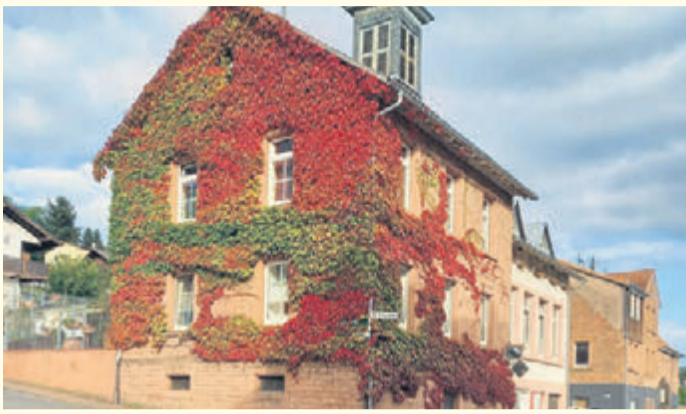
Das alte Schulhaus. Heute beherbergt es die zweigruppige evangelische Kita.

Nieder-Kinzig ist zur Erholung geeignet: Ringsum schweift