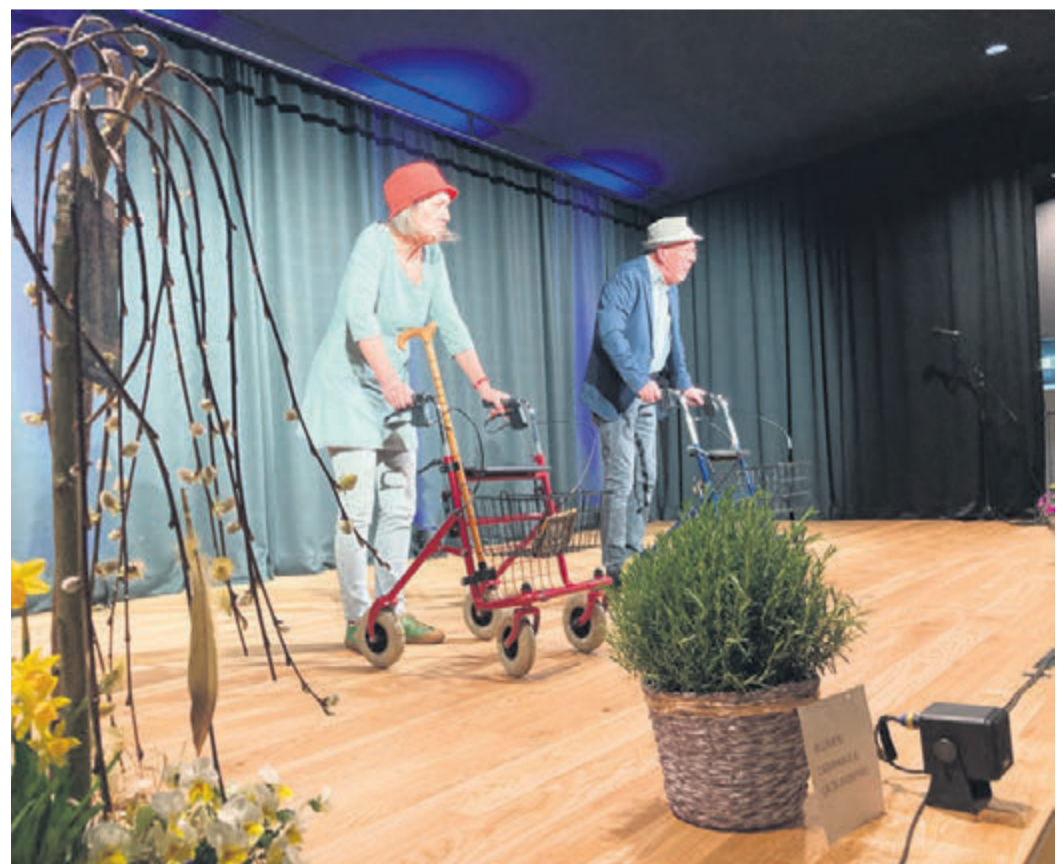
Unter anderem mit einem „Rollator-Rap“ unterhielt das Duo Kabbaratz das Publikum.

und Spinner“ wurde schlussendlich mit dem „Rollator-Rap“ gekrönt. Am 24. August wird zum dritten Mal im Odenwald durch den „Fellowsride“ für Depressionshilfe und Suizidprävention demonstriert. Am 18. September wird der Dokumentarfilm „Expedition Depression“ zu sehen sein. Der genaue Ort der Veranstaltung wird noch bekannt gegeben. Am 18. Oktober findet im Rahmen der „Tage der seelischen Gesundheit“ im Odenwaldkreis ein Informationsabend statt. red