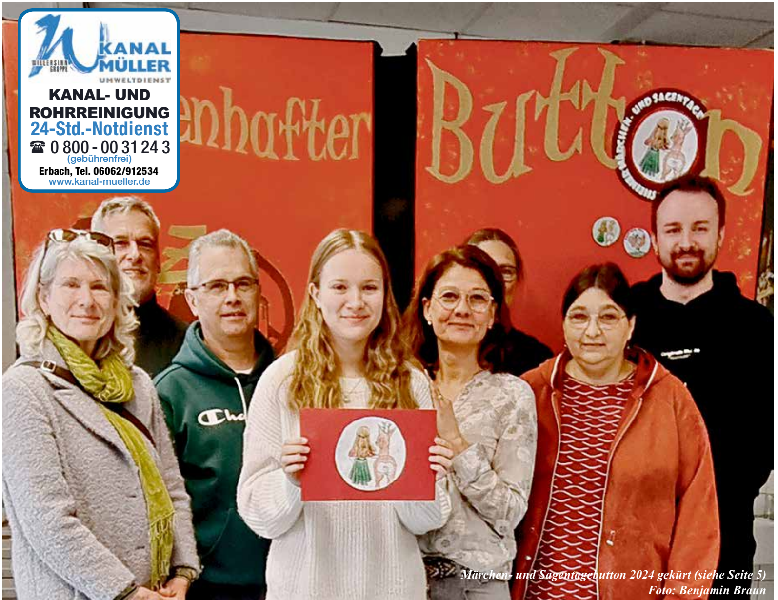
Märchen- und Sagentagebutten 2024 gekürt (siehe Seite 5)