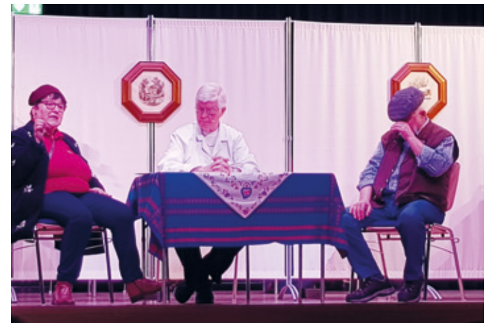
Dieses Foto entstand bei der Aufführung in Braunshardt.

Erzhausen (ew). Hallo Ihr Lieben, zur Erinnerung, am 16. April um 14.30 Uhr, Saalöffnung 14.00 Uhr, gastiert die Theatergruppe „Rossdorfer Spätlese“ im Bürgerhaus Erzhausen.