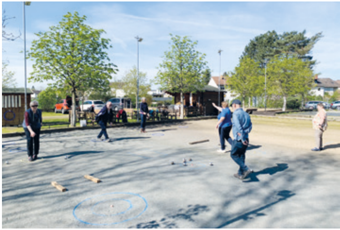
Training mit Gisela im Arheilger Bouldrome.

Arheilgen (kt). Zur Saisonvorbereitung 2024 fanden in den letzten Wochen drei Trainingsworkshops mit Gisela Meller, Trainerin des Hessischen Landesverbandes im Bouldrome der SGA statt. Insgesamt nahmen 24 Spieler/-innen an den Trainingseinheiten teil. Mit großer Begeisterung wurden neue Wurftechniken einstudiert und bereits erlangte Fähigkeiten ausgebaut und verfeinert. Die Trainingsein-