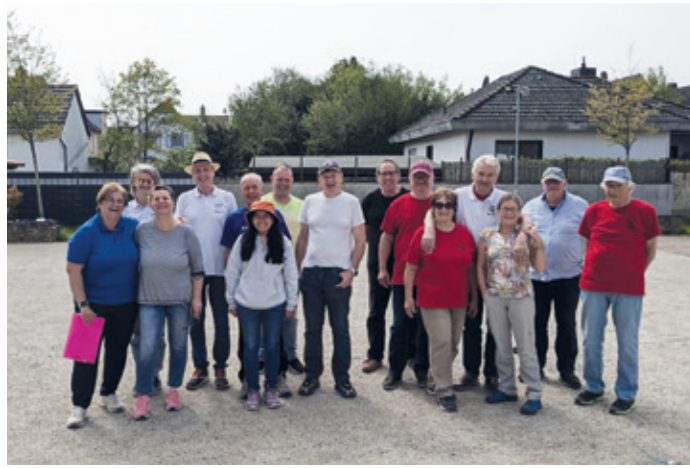
Boule-Breitensportabzeichen beim TV-Crumstadt.

Eine erste Überprüfung der neuen Fähigkeiten erfolgte am letzten Sonntag in Crumstadt. Die befreundeten Bouler/-innen des TV-Crumstadt richteten in diesem Jahr die Abnahme des Boule-Breitensportabzeichens aus.