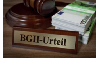
Starkes Urteil für Versicherte.

auch heute noch anfechtbar. Man nennt dies „ewiges Widerrufsrecht“. Bei einem Widerruf erhalten Sie – anders als bei der Kündigung – alle eingezahlten Beiträge ohne Abzug von Maklerprovisionen und Verwaltungskosten zurück. Und nicht nur das: Die Versicherung muss Ihnen eine sogenannte Nutzungsentschädigung dafür zahlen, dass Sie mit Ihrem Geld Gewinne erwirtschaftet hat. So können Sie im Idealfall bis zum Doppelten der eingezahlten Beiträge zurückerhalten. Ein sattes Plus auf Ihrem Konto winkt – in Zeiten hoher Inflation eine wirklich gute Nachricht!