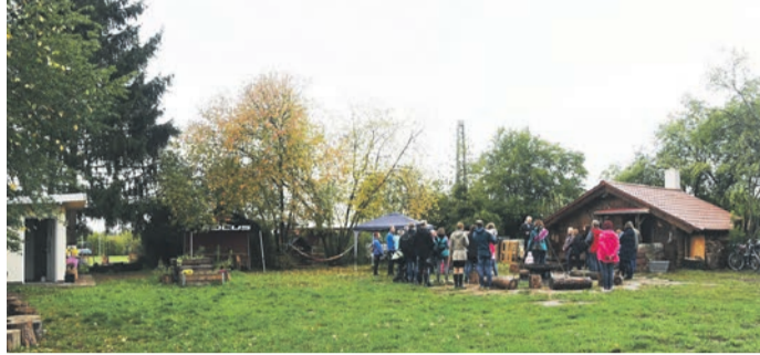
Die Münsterer Familien sehen die geplante Erhöhung der Kita-Gebühren laut einer Erhebung des Gesamtelternbeirats äußerst kritisch. Das Foto zeigt einen Teil des Geländes der naturnahen Gruppe des „Haus der Kinder“.

Manche verbinden mit dem Plan auch die Annahme, „dass die Gemeinde versucht, ihre Zahlen zu richten, ohne dass es den Kindern zugute kommt“. Tatsächlich sollen mögliche Mehreinnahmen zunächst nicht zu einer besseren Betreu-