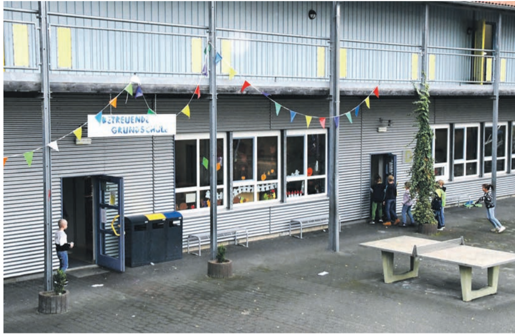
Blick auf den Bereich der „Betreuenden Grundschule“ an der Eppertshäuser Stephan-Gruber-Schule. Zum neuen Schuljahr übernimmt dort der Kreis die Betreuung vom Förderverein. Dies war nur eine von mehreren Neuigkeiten zur Kinderbetreuung in der jüngsten Sitzung der Gemeindevertretung.

Kita-Gebühren: Von Änderungen beim Verpflegungsentgelt abgesehen, sind die Kita-Gebühren in Eppertshausen sowohl im U3-Bereich als auch bei den Kindern ab drei Jahren (wo nur die Betreuung nach 13 Uhr bezahlt werden muss) seit 2014 konstant. Der Zuschuss, den die Gemeinde trägt, ist für die beiden Kindertagesstätten St. Sebastian und Sonnenschein zwischenzeitlich allerdings von einer Million Euro auf zweieinhalb Millionen gestiegen. Deshalb erwägt das Rathaus nun eine Erhöhung der Gebühren und lässt sie von einer externen Firma neu kalkulieren. Helfmann berichtete, dabei kämen voraussichtlich horrendere Werte von 800 Euro monatlichem Elternbeitrag bei einem Ü3-Kind und 1 500 Euro pro Ü3-Platz und Monat heraus. „Dies werden wir sicher nicht in Rechnung stellen“, versprach er. Teurer werden - voraussichtlich ab 2025 - dürfte es aber trotzdem. Aus Sicht der Verwaltung und auf Empfehlung des Eppertshäuser Kita-Beirats soll stattdessen eine prozentu-