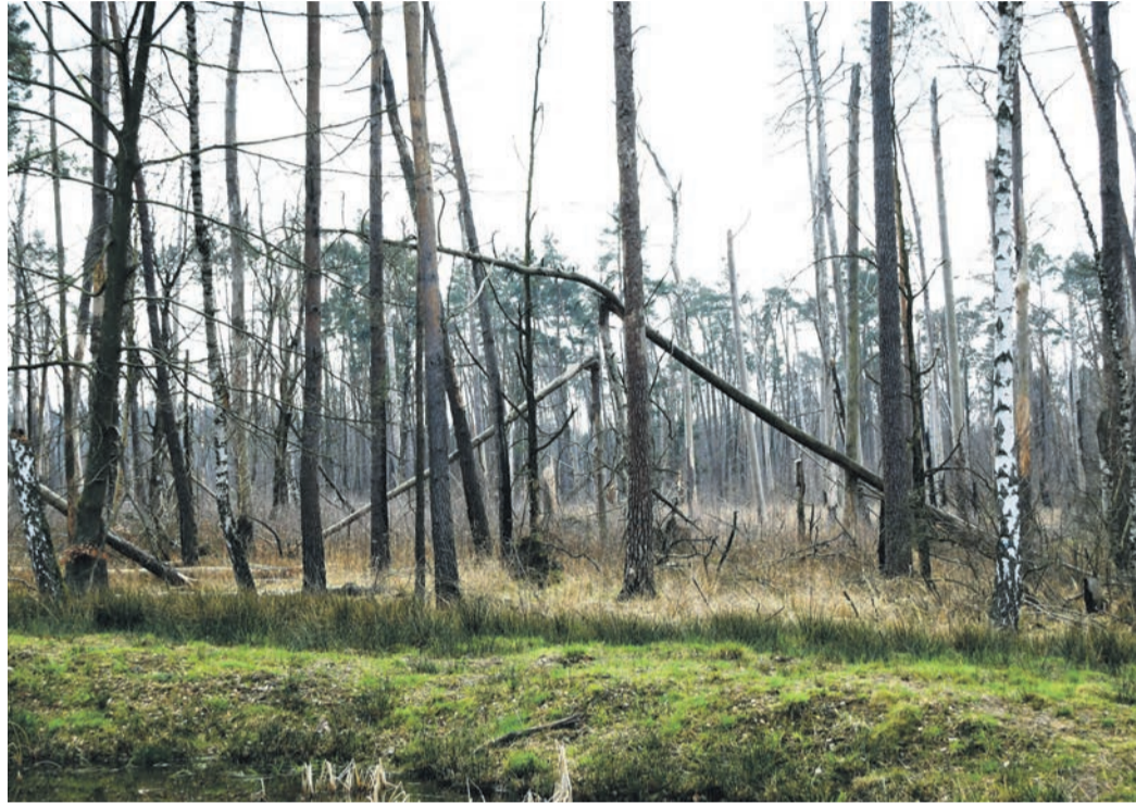
Blick in den durch Sturm und Feuer mitgenommenen Wald nahe der Muna bei Breitfeld. Ein neuer „Klimabeirat“ und eventuell auch eine IKZ mit Eppertshausen sollen nach dem Willen der Münsterer Gemeindevertreter künftig ihre Beitrag zum lokalen Klimaschutz leisten.

Dies fanden im Grunde auch die Vertreter von CDU, FDP und SPD unterstützenswert. Allerdings stimmten dann doch nur Liberale und Genossen mit dem Antragsteller. Die Christdemokraten hatten sich zugleich gewünscht, dass die Einführung des Klimabeirats das Ende des bestehenden „Energietischs“ bedeuten möge. „Zwei Gremien nebeneinander machen nur Arbeit und bringen keinen Mehr-