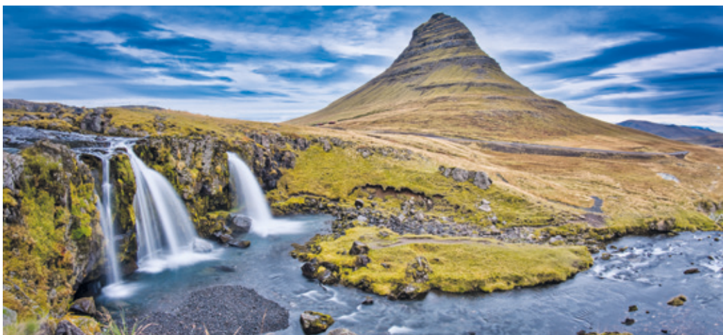
Der malerische Berg Kirkjufell und der Wasserfall Kirkjufellsfoss auf der Snæfellsnes-Halbinsel.

Neue Live-Reportage von Stefan Seibold, am kommenden Freitag, 19. April