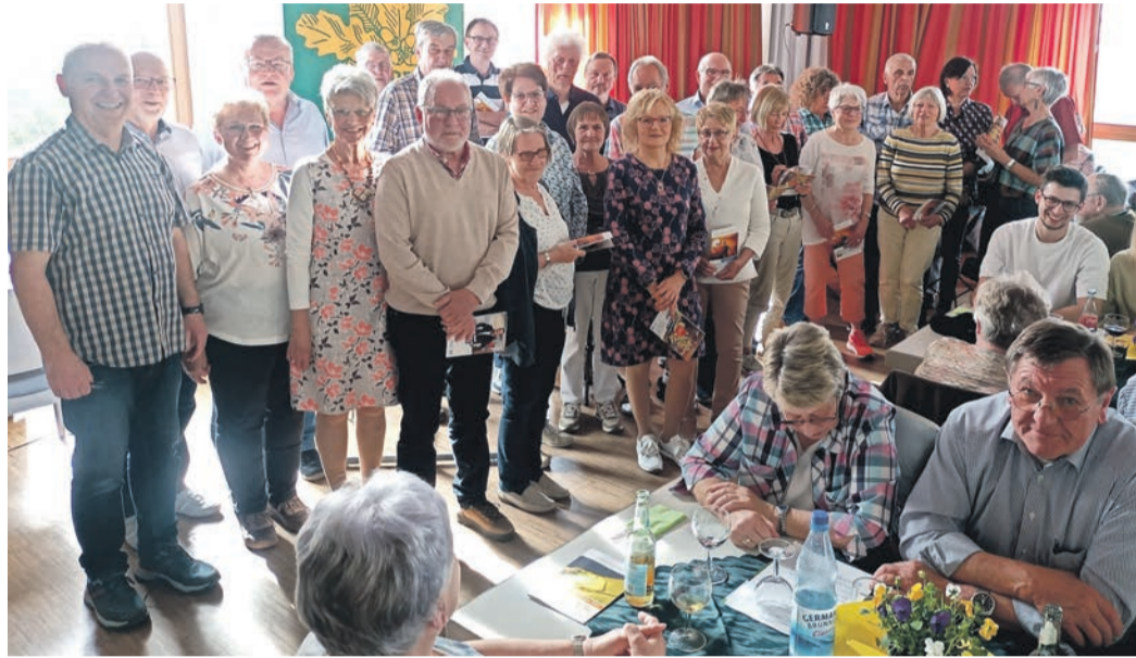
Die Wandersparte ehrte jene Mitglieder, die sich die meisten Touren nicht entgehen ließen.

Das geschah im Rahmen des Ehrungsabends, der beim OWK noch eine recht junge Erfindung darstellt. Erst zum zweiten Mal fand er nun im Haus