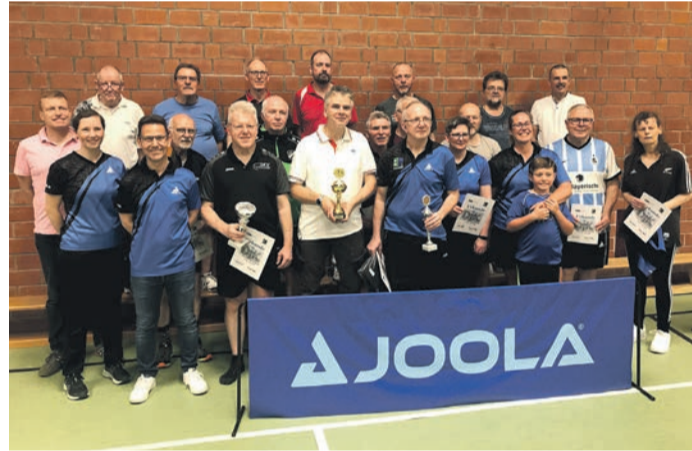
Das erste PingPongParkinson-Turnier in Münster ist zu Ende. Teilnehmer, Ausrichter und die Turnierleitung stellen sich dem Fotografen.

Münster (MA) Eine ganz neue Turniererfahrung machte die erfahrene Tischtennisabteilung der der DJK Münster. Viele Turniere hatte die Abteilung in ihrer langen Geschichte schon ausgerichtet. Jetzt kam am 13. April ein völlig neues Turnier hinzu. PingPongParkinson-Stada-Cup hieß es jetzt für die 15 Teilnehmer und die zwei Teilnehmerinnen im DJK-Sportzentrum. Bis von Hannover waren sie angereist, jetzt standen sie sich an den neuen blauen Tischen im DJK-Sportzentrum gegenüber. Alle hatten eines gemeinsam, sie sind an Parkinson erkrankt und Tischtennis hilft ihnen auch im täg-