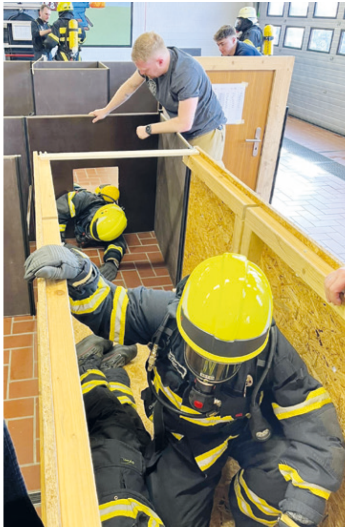
Einsatzkräfte in der Atemschutzstrecke bei der Rettung eines verunfallten Kameraden.

Danach folgte eine Belastungsübung. Hier wurde eine spezielle Atemtechnik, die sogenannte Box-Atmung, vermittelt, welche unter körperlicher und psychischer Anspannung dafür sorgen kann, dass der Atemschutzgeräteträger weniger Luft verbraucht. Nach dieser Übung galt es beim sogenannten Denver-Drill in