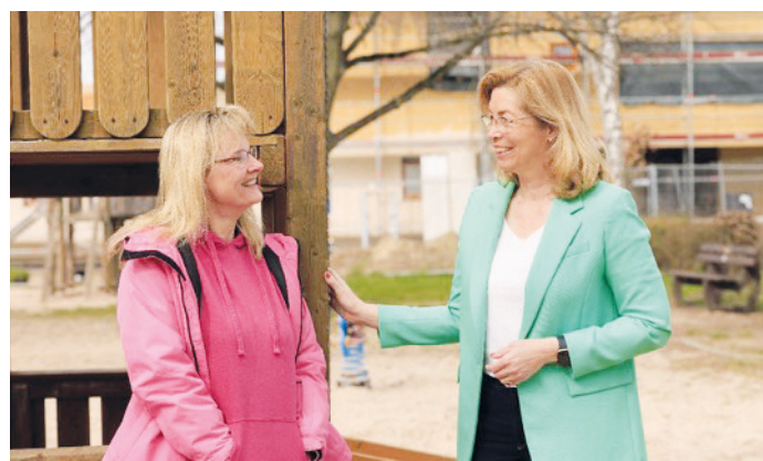
Spielfeld und Neubau Kita Hainpfad.

„Ich hatte eine schöne Kindheit“ sagte mein Sohn vor einiger Zeit und meinte Erzhausen: Die Kita- und Grundschulzeit, den Vereinsport, die Freunde und die Bewegungsfreiheit im Grünen. Ich setze mich dafür ein, den Kindern und Jugendlichen, den Erwachsenen sowie den Seniorinnen und Senioren hier einen lebenswerten, schönen und vielseitigen Lebensmittelpunkt zu bieten. Lesen Sie in dieser Woche, was dies für Familien mit Kindern und Jugendlichen bedeutet.