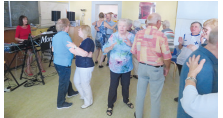
Beim Sommertanz 2023.