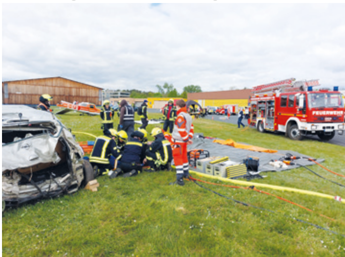
Die Freiwillige Feuerwehr Erzhäuser bei der Rettung der im Pkw eingeklemmten Insassen. Im Hintergrund das verunfallte Kleinflugzeug.

(kr). Am Samstag, den 20. April, wurde eine große Einsatzübung von Feuerwehr, Rettungsdienst und Polizei am Flugplatz Egelsbach durchgeführt. Bei der angenommenen Lage verlor der Pilot eines Kleinflugzeuges aufgrund gesundheitlicher Probleme bei der Landung die Kontrolle über seine Maschine. Am Boden auf dem Vorfeld kollidierte er mit einem Pkw des Bodenpersonals. Die Insassen des Kleinflugzeuges und des Pkws wurden beim Zusammenstoß verletzt und eingeklemmt. Herumfliegende Trümmerteile trafen eine sich in diesem Bereich befindliche Besuchergruppe und verletzte einige davon schwer. Teile des Flugzeuges gerieten in Brand.