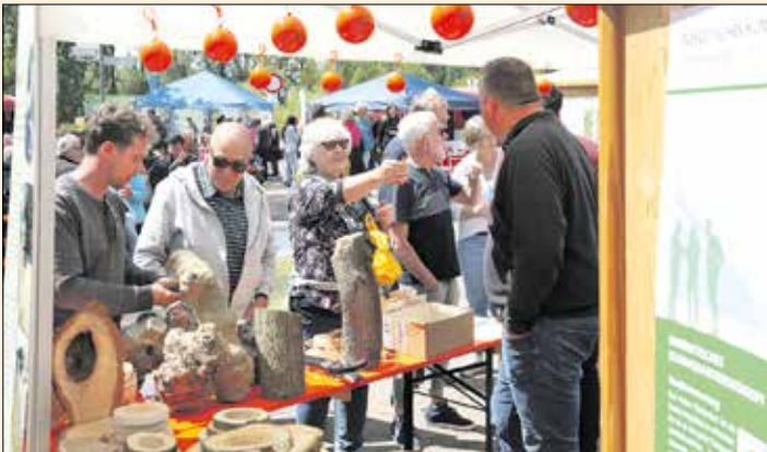
Auch die Fachgruppe Umwelt wird wie im letzten Jahr wieder mit einem Stand auf dem Ökomarkt vertreten sein.

Zum Frühschoppen bei hoffentlich glänzend blauem Himmel erwartet die Gäste ab 11.00 Uhr die Gruppe „Pulso“. Die Musiker mischen traditionelle spanische Gitarrenmusik mit Latin- und Jazz-Elementen. Mit Zauberei begeistert ab 14.30 Uhr Magic Alex kleine und große Zuschauer. Der Auszeit-Bus des Jugendbüros mit Spiel- und Sport-Angeboten steht ab etwa 11.00 Uhr bereit.