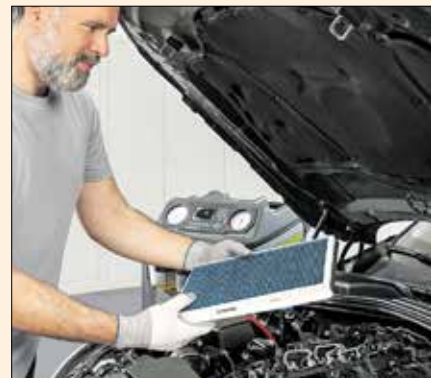
Mindestens einmal pro Jahr sollte der Innenraumfilter fürs Auto erneuert werden.