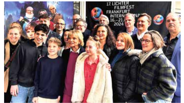
Gruppenbild von Cast und Produktionscrew.

Die Fortsetzungsgeschichte von „Max und die Wilde 7“ wurde größtenteils in Hessen gedreht und ist ab Mai überall im Kino zu sehen.