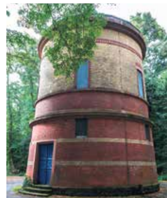
Zylindrischer Wasserturm von 1899, im Fechenheimer Wald

Das Fechenheimer Mainufer spielt eine entscheidende Rolle in der Geschichte des Stadtteils. Ursprünglich als Fischerdorf gegründet, profitierte Fechenheim später stark von seiner Lage am Main. Während früher der Fluss für die Industrialisierung entscheidend war, ist er heute ein Ort der Entspannung und Erholung. Die Uferpromenade lädt zum Verweilen ein und bietet einen herrlichen Blick auf den Mainbogen, der die Grenze zwischen Frankfurt und Offenbach markiert. Ein Spaziergang entlang des Fechenheimer Mainufers offenbart die Schönheit dieser Gegend. Beginnend östlich der Mainkur erstreckt sich das Ufer bis zum Osthafen. Hier finden sich nicht nur idyllische Wege, sondern auch die Schiffsanlegestelle der AllessaChemie und eine malerische Pappelallee,