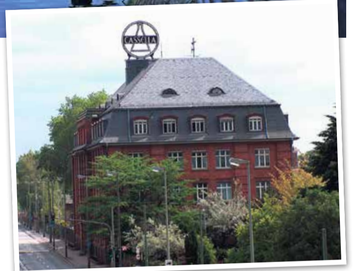
Ehemaliges Hauptgebäude der Cassella

ren auf seine heutige Größe von 2,6 Hektar erweitert wurde. Ebenfalls ein Highlight ist der 8,62 Hektar große Waldspielpark „Heinrich-Kraft-Park“, der 1969 errichtet wurde. Durch die Bundesautobahn 66 ist der Fechenheimer Wald vom Enkheimer Wald getrennt. Ein markantes Merkmal ist das Wasserwerk, das die Trinkwasserversorgung der östlichen Frankfurter Stadtteile sicherstellt und das gesamte Gebiet als Trinkwasserschutzgebiet ausweist. In jüngerer Zeit sorgten Baumsetzungen entlang der geplanten Trasse des Riederwaldtunnels für Aufsehen. Trotz Protesten und einem „Baumhausdorf“, das von Aktivisten, darunter Anwohnern, errichtet wurde, wurde im Januar 2023 entschieden, dass die Teilrodung zur Fortführung der A66 beginnen könne. Dies löste einen dreitägigen Einsatz mit 1800 Einsatzkräften aus, um die Besetzung aufzulösen. Der Bundesverband der Naturfreunde hatte mit einem Eilantrag versucht, den Lebensraum des Heldbockkäfers zu schützen.