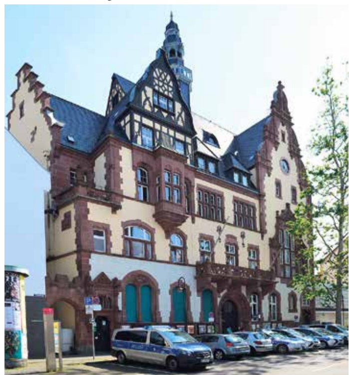
Das ehemalige Rathausgebäude

Der Fechenheimer Wald, auch als Fecher bekannt, liegt nördlich des Stadtteils und ist ein bedeutender Bestandteil des Frankfurter Grüngürtels. Hier finden sich vor allem alte Eichen, Hainbuchen und Douglasien, die auf den sandigen Ablagerungen des alten Mainbetts gedeihen. Der Wald beheimatet den Fechenheimer Weiher, der ursprünglich um 1870 aus einer ehemaligen Kiesgrube entstand und in den 1960er-Jah-