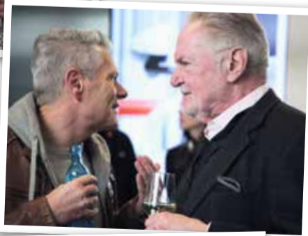
Gäste diskutierten über den neuen Polestar 4.