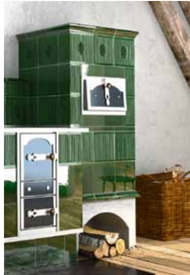
Zu zehn Prozent kann der regenerative Energieträger Holz auf die 65-Prozent-Erneuerbare-Energien-Vorgabe des neuen Gebäudeenergiegesetzes (GEG) angerechnet werden.

pro Tonne CO 2 plus Mehrwertsteuer. Für Verbraucherinnen und Verbraucher ergeben sich daraus erhebliche Mehrbelastungen. Die Alternative: