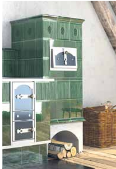
Zu zehn Prozent kann der regenerative Energieträger Holz auf die 65-Prozent-Erneuerbare-Energien-Vorgabe des neuen Gebäudeenergiegesetzes (GEG) angerechnet werden.

pro Tonne CO 2 plus Mehrwertsteuer. Für Verbraucherinnen und Verbraucher ergeben sich daraus erhebliche Mehrbelastungen. Die Alternative: