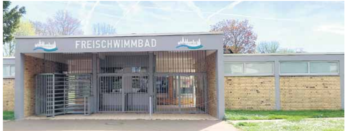
Eingang Schwimmbad in grau.

Im Kleinkinderbereich musste der Entwässerungskanal erneuert wer-