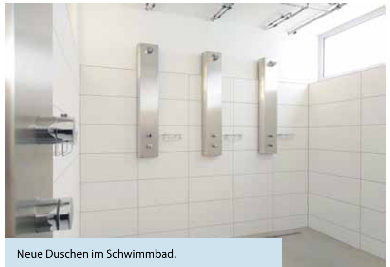
Neue Duschen im Schwimmbad.