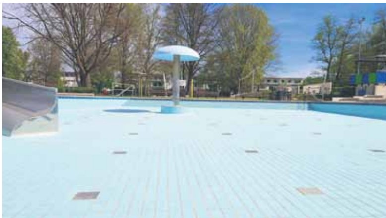
Schwimmbadbecken noch leer.