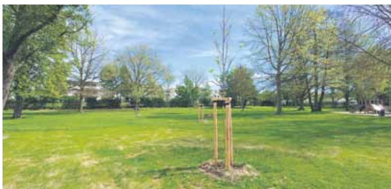
Wiese im Schwimmbad.

vorgenommen, so dass der Neubefüllung nichts mehr im Wege steht. Auf den Liegewiesen wurden die Hecken geschnitten und Baumneupflanzungen vorgenommen. Bis zum Saisonstart bekommen noch die Sitzbänke einen neuen Anstrich und der Rasen besondere Pflege, dann sind die Freiflächen für die Badegäste hergerichtet. „Unsere beiden Fachangestellten für Bäderbetriebe reinigen in den nächsten Wochen die Becken, befüllen sie mit Frischwasser und nehmen die Anlage in Betrieb. Dann muss nur noch das Wetter mitspielen, damit am 13. Mai möglichst viele Freibadfans den Sprung ins kühle Nass