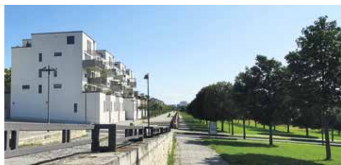
Dicht an dicht reihen sich die Häuser im Viertel.

Zustellhotline: Tel. 06104-4970-0 Mo. – Fr. 8.00 – 16.30 Uhr