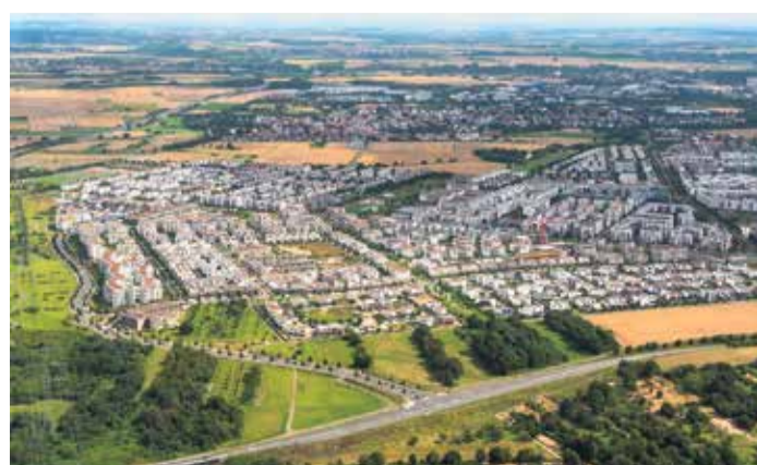
Die Riedberg-Siedlung im Jahr 2021.