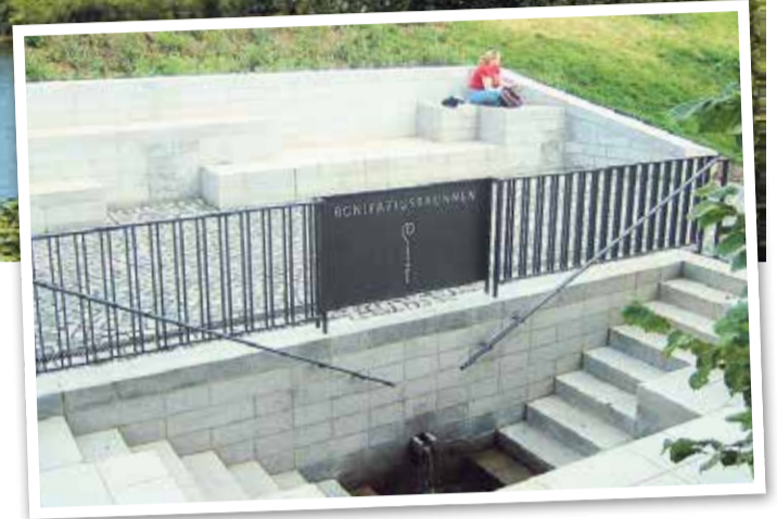
Bonifatiusbrunnen am Hang der Kalbacher Höhe

In den 1990er Jahren wurde der Frankfurter Stadtteil Riedberg als ehrgeiziges Projekt gestartet,