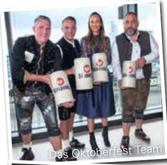
Das Oktoberfest Team