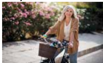
Bewegung stärkt die Knochen

Unterstützen kann hier die neue App „Osteoporose Risikowissen“, die der Berufsverband für Orthopädie und Unfallchirurgie (BVOU) für Ärzt:innen und Gesundheitsberufe, aber auch zur Nutzung durch Patient:innen entwickelt hat. Die App kann kostenfrei in den Android- oder Apple-Appstores heruntergeladen werden und dazu beitragen, die eigene Frakturwahrscheinlichkeit einzuschätzen. Wichtig dabei: Besprechen Sie die Ergebnisse immer mit Ihrer Ärztin oder Ihrem Arzt, denn