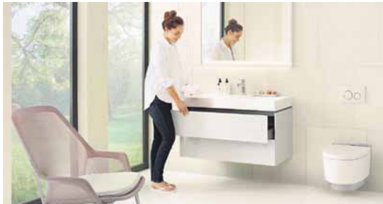
Das „papierlose WC“, das den Po mit frischem Wasser reinigt, ist auch in Deutschland auf dem Vormarsch, denn es verbessert die Intimhygiene und gibt ein frisches Gefühl.

Den Po mittels eines Dusch-WCs mit Wasser zu reinigen, ist die natürlichste und angenehmste Art der Intimhygiene. Das mag anfangs