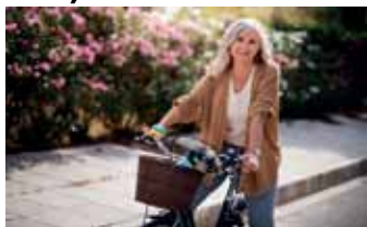
Bewegung stärkt die Knochen.

Unterstützen kann hier die neue App „Osteoporose Risikowissen“, die der Berufsverband für Orthopädie und Unfallchirurgie (BVOU) für Ärzt:innen und Gesundheitsberufe, aber auch zur Nutzung durch Patient:innen entwickelt hat. Die App kann kostenfrei in den Android- oder Apple-Appstores heruntergeladen werden und dazu beitragen, die eigene Frakturwahrscheinlichkeit einzuschätzen. Wichtig dabei: Besprechen Sie die Ergebnisse immer mit Ihrer Ärztin oder Ihrem Arzt, denn