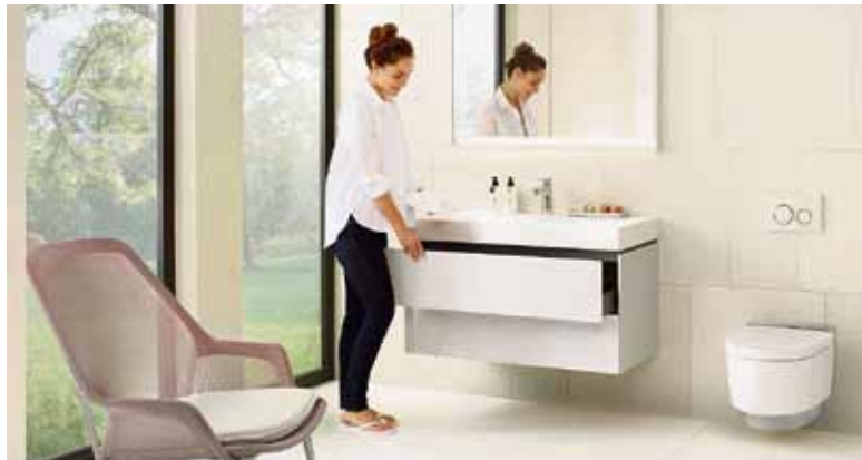
Das „papierlose WC“, das den Po mit frischem Wasser reinigt, ist auch in Deutschland auf dem Vormarsch, denn es verbessert die Intimhygiene und gibt ein frisches Gefühl.

Den Po mittels eines Dusch-WCs mit Wasser zu reinigen, ist die natürlichste und angenehmste Art der Intimhygiene. Das mag anfangs