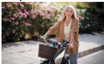
Bewegung stärkt die Knochen

Unterstützen kann hier die neue App „Osteoporose Risikowissen“, die der Berufsverband für Orthopädie und Unfallchirurgie (BVOU) für Ärzt:innen und Gesundheitsberufe, aber auch zur Nutzung durch Patient:innen entwickelt hat. Die App kann kostenfrei in den Android- oder Apple-Appstores heruntergeladen werden und dazu beitragen, die eigene Frakturwahrscheinlichkeit einzuschätzen. Wichtig dabei: Besprechen Sie die Ergebnisse immer mit Ihrer Ärztin oder Ihrem Arzt, denn