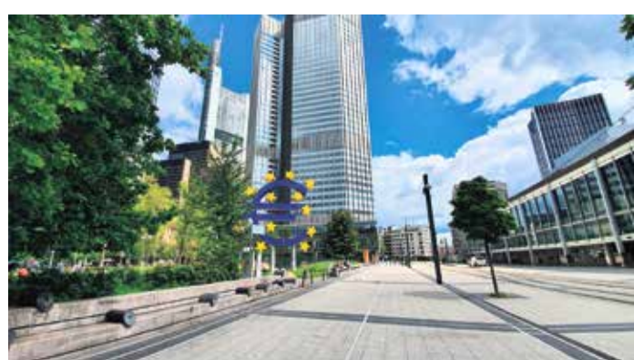
Euro-Skulptur am Willy-Brandt-Platz.