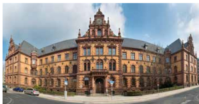
Das historische Gerichtsgebäude A.