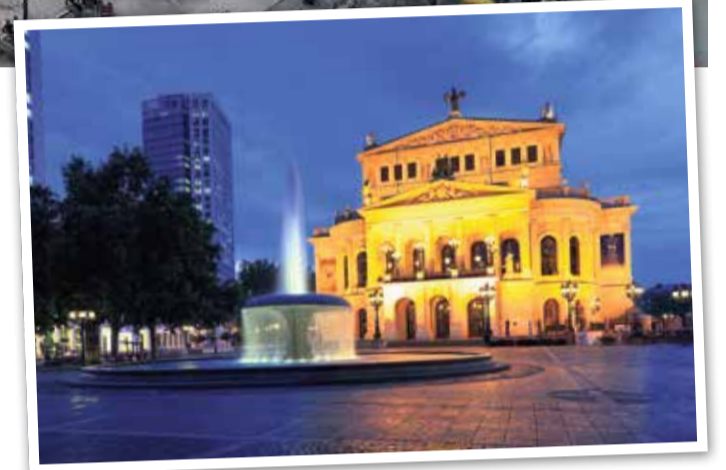
Alte Oper, Opernplatz und Luciae-Brunnen

Am Willy-Brandt-Platz finden Sie das städtische Opern- und Schauspielhaus sowie den imposanten Eurotower und die Europa Skulptur. Der Platz, benannt nach dem ehemaligen Bundeskanzler Willy Brandt, verbindet Fußgänger, Autofahrer, Straßenbahnen und die U-Bahn. Nach dem Bau des Theatertunnels wurde der Verkehr größtenteils unter die Erde verlegt, was den Platz sicherer und angenehmer macht. Der U-Bahnhof Willy-Brandt-Platz ist ein wichtiger Knotenpunkt, wo sich mehrere U-Bahnlinien treffen. Seit 2005 ist der Platz barrierefrei und bietet mobilitätseingeschränkten Besuchern einen stufenlosen Zugang zur Oper und zum Schauspielhaus.