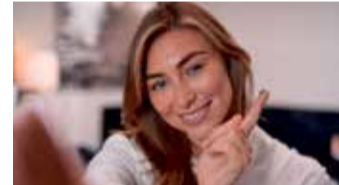
Bekommt man einen Splitter nicht richtig heraus, kann sich ein Eiterherd bilden.

Ganz natürlich geht durch die grüne ilon Salbe classic die Entzündung zurück. Das umliegende Gewebe wird weich. Unliebsame Splitter können schonend entfernt werden.