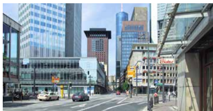
Neue Mainzer Straße, vom „Willy-Brandt-Platz“.

Vom 22. bis 31. Mai 2024, täglich von 12 bis 23 Uhr, heißt es wieder: Flanieren, genießen und schlemmen in Frankfurts „Großer Bockenheimer Straße“. Das Freßgass Fest ist das lang erwartete Signal für den Frühlingsbeginn in der Stadt. Traditionell eröffnet es die Saison der Straßenfeste und lockt Feinschmecker aus nah und fern an. Mit einer Vielzahl von traditionsreichen Geschäften und erstklassigen Restaurants ist die Freßgass perfekt für ein gehobenes, dennoch entspanntes Straßenfest. Hier können Sie zu den besten Klängen flanieren, edle Tropfen verkosten und sich kulinarisch verwöhnen lassen. Zudem bieten verschiedene Musikdarbietungen und Aktivitäten für Groß und Klein ein abwechslungsreiches Programm. Der Veranstalter, die Aktionsgemeinschaft Freßgass' e.V., lädt Sie herzlich ein, Teil dieses einzigartigen Festes zu sein und dankt Ihnen für Ihre Unterstützung, die auch zur Finanzierung der Weihnachtsbeleuchtung beiträgt.