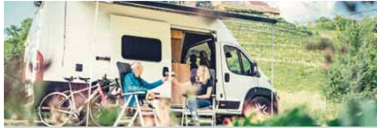
Burg Neipperg bei Brackenheim ist von Weinbergen umgeben.

Für Wohnmobil-Reisende ist die Kulturregion zwischen Würzburg, Nürnberg, Stuttgart und Heidelberg aus ganz Deutschland gut zu erreichen. So zum Beispiel Bad Wimpfen: Hoch über dem Neckar thront die Altstadt mit der Kaiserpfalz zwischen liebevoll restaurierten Fachwerkhäusern. Beim Spaziergang durch die mittelalterlichen Gassen entdecken die Urlauber kleine Bauerngärten. Und vom Blauen Turm, der heute als Wahrzeichen der Stadt gilt, können sie ihren Blick über das Neckartal schweifen lassen. An den schönsten Orten finden sie zahlreiche Stellplätze, häufig nur ein paar