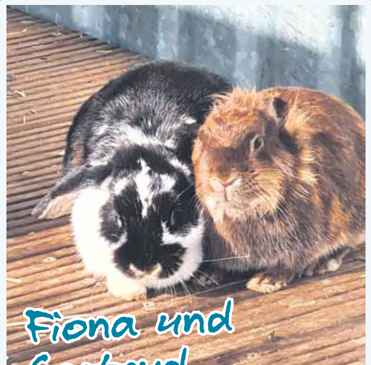
Fiona und Gertrud

Weitere Informationen unter Hoffungsvolle Tierblicke e.V. www.htb-ev.de | Tel. 06068-4785493 o. 0162-2939838