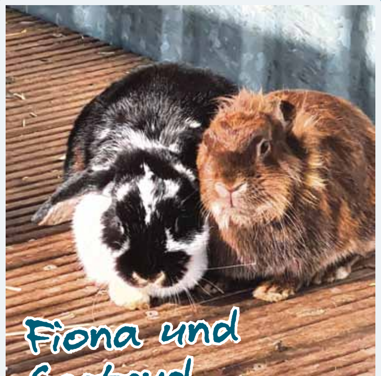
Fiona und Gertrud

Weitere Informationen unter Hoffungsvolle Tierblicke e.V. www.htb-ev.de | Tel. 06068-4785493 o. 0162-2939838