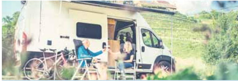
Burg Neipperg bei Brackenheim ist von Weinbergen umgeben.

Für Wohnmobil-Reisende ist die Kulturregion zwischen Würzburg, Nürnberg, Stuttgart und Heidelberg aus ganz Deutschland gut zu erreichen. So zum Beispiel Bad Wimpfen: Hoch über dem Neckar thront die Altstadt mit der Kaiserpfalz zwischen liebevoll restaurierten Fachwerkhäusern. Beim Spaziergang durch die mittelalterlichen Gassen entdecken die Urlauber kleine Bauergärten. Und vom Blauen Turm, der heute als Wahrzeichen der Stadt gilt, können sie ihren Blick über das Neckartal schweifen lassen. An den schönsten Orten finden sie zahlreiche Stellplätze, häufig nur ein paar