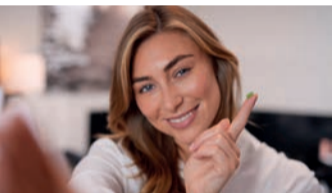
Bekommt man einen Splitter nicht richtig heraus, kann sich ein Eiterherd bilden.

„Autsch!“ Ein Splitter steckt im Finger. Man entfernt das störende Teil, Bakterien oder Viren gelangen dabei in den Körper. Der Finger wird rot und tut unangenehm weh. Exakt hier greift die grüne ilon Salbe classic ein. Haut-Entzündungen, die überall am Körper auftauchen können, schmälern das gesamte Wohlfühl. Viele Betroffene suchen nach einer Behandlungsmöglichkeit ohne Kortison. „ilon Salbe classic“ ist eine Allzweckwaffe für verschiedene Hautprobleme*, urteilen Apotheken-Kund:innen. Ganz natürlich geht durch die grüne ilon Salbe classic die Entzündung zurück. Das umliegende Gewebe wird weich. Unliebsame Splitter können schonend entfernt werden.