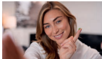
Bekommt man einen Splitter nicht richtig heraus, kann sich ein Eiterherd bilden.

Haut-Entzündungen, die überall am Körper auftauchen können, schmälern das gesamte Wohlfühl. Viele Betroffene suchen nach einer Behandlungsmöglichkeit ohne Kortison. „ilon Salbe classic“ ist eine Allzweckwaffe für verschiedene Hautprobleme**, urteilen Apotheken-Kund:innen.