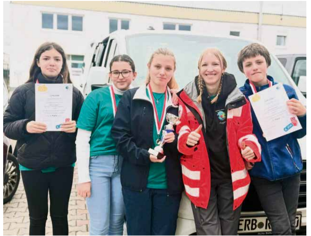
Die Jugendlichen des DRK-Ortsvereins freuen sich über Medaillen, Pokal und Urkunden.