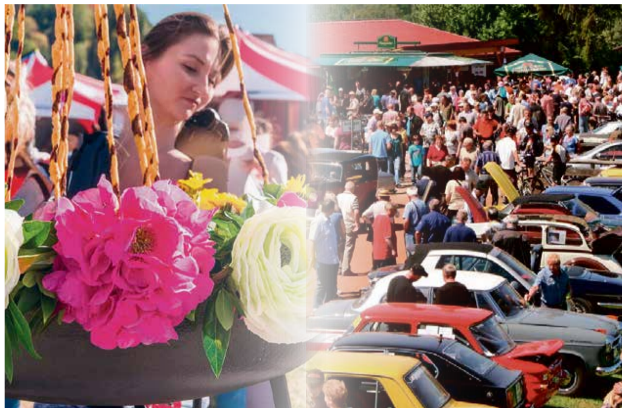
Der freie Tag lockt bei gutem Wetter zu vielen Veranstaltungen – ein großes Ereignis ist das Grillfest und Oldtimer-Treffen. Mehr dazu auf Seite 6 und 7.

Odenwaldkreis. In wenigen Tagen ist es so weit – der Mai beginnt, und zwar zunächst mit einem Feiertag. Um das Datum des 1. Mais und den Tag davor ranken sich viele Traditionen und Mythen. So heißt die Nacht davor „Walpurgisnacht“. Hexen, so der Aberglaube, sollten sich in dieser Nacht auf den Weg zum Blocksberg im Harz machen, um dort einen Hexentanz aufzuführen. Beliebte sind auch die Tänze in den Mai und der Tanz um den Maibaum. Im Odenwaldkreis gibt es hier beispielsweise auch das Oldtimertreffen und