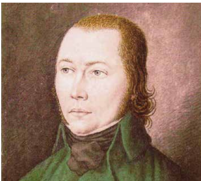
Der Schinderhannes, Gemälde.