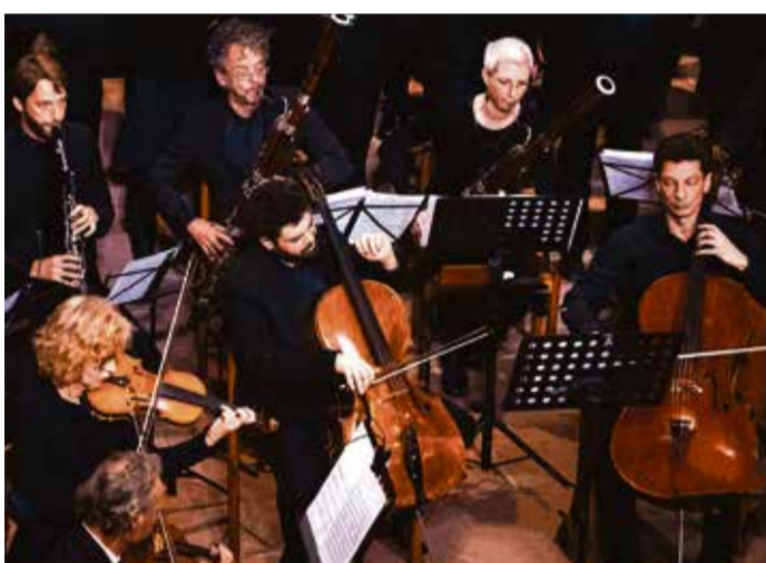
Ausschnitt aus dem Ensemble Capriccio.