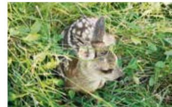
Ein Rehkitz im Gras.

über Tel.: 0172-6860873. Der Verein präsentiert sich auch auf dem Hoffest der Familie Schäfer-Wolf am Sonntag, 28. April, ab 11 Uhr in Dusenbach. red