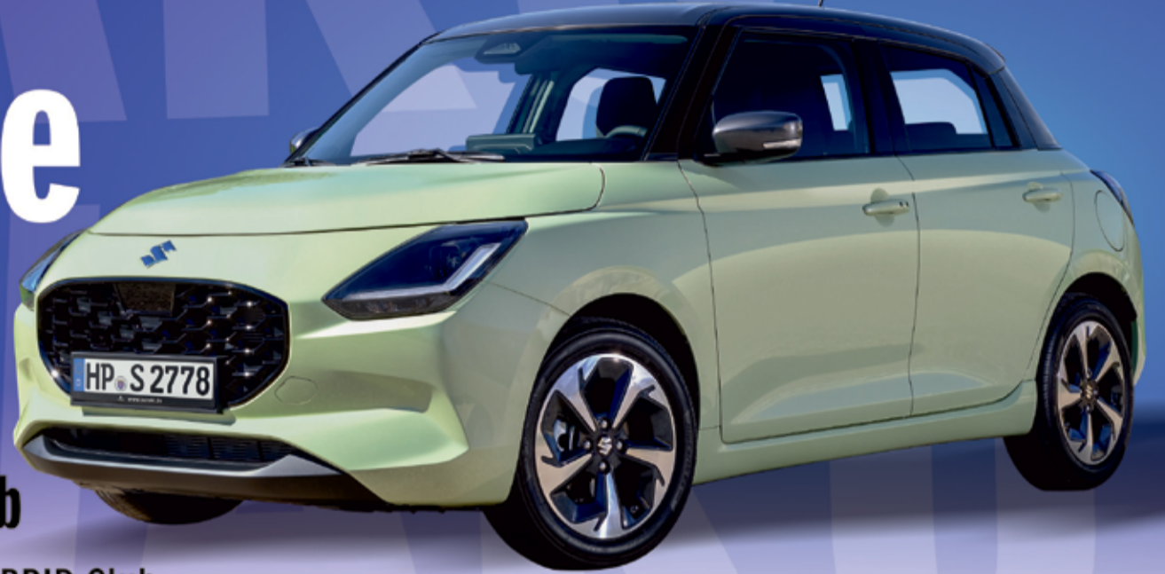
Abbildung zeigt aufpreispflichtige Sonderausstattungen.

Der neue Suzuki Swift 1.2 DUALJET HYBRID Club 61 kW | 82 PS | 5-Gang-Schaltgetriebe Hubraum 1.197 ccm | Kraftstoffart Super E10 Energieverbrauch (kombiniert): 4,4 l/100km CO 2 -Emission (kombiniert): 98 g/km; CO 2 -Klasse: C