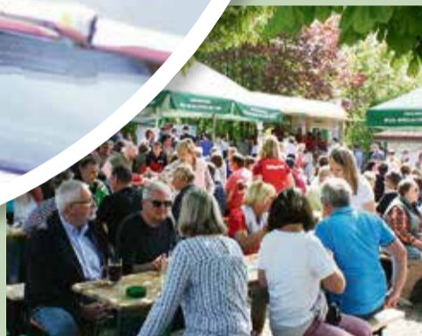
Ein Eindruck vom Grillfest aus den vergangenen Jahren.

rios und Motorrädern, die sich auf dem Weg zum Vereinsgelände der SG befinden. Bei freiem Eintritt können die Gäste dort zwischen Oldtimern flanieren und kühle Getränke, Leckereien vom Grill sowie ein reichhaltiges Kuchen- und Tortenangebot genießen. Mit feinsten Blasmusik sorgt die Langen-Brombacher Blaskapelle zudem für gute Stimmung. Die kleinen Gäste dürfen sich derweil auf und rund um die Hüpfburgen vergnügen. Einen Eindruck vom Grillfest kann man sich über die Bilder aus den vergangenen Jahren auf www.sgniederkainsbach.de holen.