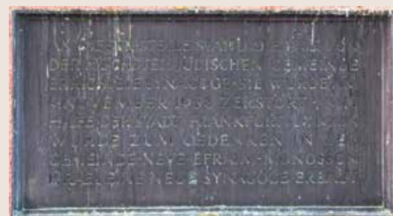
Gedenktafel für die Synagoge am Höchster Markt.

In Höchst gab es lange Zeit eine kleine jüdische Gemeinde, deren Ursprünge bis ins 17. Jahrhundert zurückreichen. Die Gemeinde hatte zunächst eine Synagoge in der Badstubengasse, nahe der Justinuskirche. Später, im Jahr 1905, wurde auf der Ostseite des Höchster Bürgerparks eine neue Synagoge errichtet, die jedoch während der Novemberpogrome 1938 zerstört wurde. Die jüdische Bevölkerung wurde entweder ins Ausland vertrieben oder in Konzentrationslagern ermordet. Heute erinnert eine Gedenktafel am dem Ettinghausen-Platz an die Synagoge und die tragischen Ereignisse. Der Ettinghausen-Platz, benannt nach einer der ältesten jüdischen Familien in Höchst, beherbergt die Installation "Fernrohre in die Vergangenheit", die es Besuchern ermöglicht, virtuell die zerstörte Synagoge von 1938 zu betrachten und die Geschichte der jüdischen Gemeinde zu reflektieren.